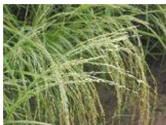
Spikoj de « teff »

Anstataŭ sin demandi kiamaniere ili povus atingi la prinutran memsufiĉon produktante pli grandajn kvantojn da rizo, la landoj devus pripensi produkti lokajn grenojn riĉajn je nutroelementoj, nun kultivataj laŭ nesufiĉa kvanto, ĉar ili estas pli malfacile rikolteblaj kaj trakteblaj.