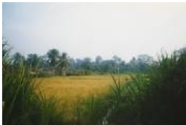
Rizkultivejo en Eburio