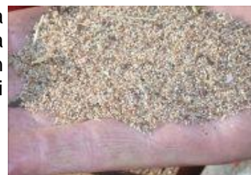
Grajnoj de « fonio »

Anstataŭ sin demandi kiamaniere ili povus atingi la prinutran memsufiĉon produktante pli grandajn kvantojn da rizo, la landoj devus pripensi produkti lokajn grenojn riĉajn je nutroelementoj, nun kultivataj laŭ nesufiĉa kvanto, ĉar ili estas pli malfacile rikolteblaj kaj trakteblaj.