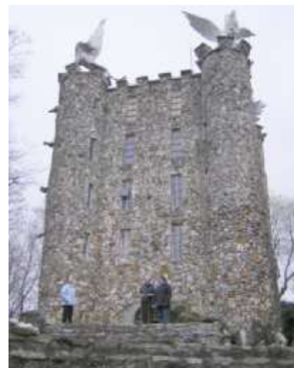
La esper-turo Eben Ezer