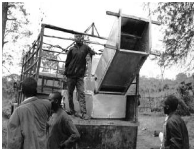
Ricevo de la elektroturbino