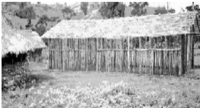
Konstruata kokidejo en Cifunzi

La 16an de januaro 2005, kunveno de la Fiŝa-Koka Kooperativo oficialigis la ricevon de la unua financoparto de sia projekto de fiŝbredado kaj de kortbredado (kokinoj, anasoj kaj kunikloj). Aranĝoj estis deciditaj por ke la solidareca kontrakto, kiu ligas FKK-Cifunzi kun Monda Solidareco kontraŭ la Malsato, estu strikte respektata, kaj interalie koncerne la devigon faritan al ĉiuj kooperativanoj esti akurataj pri siaj kotizoj.