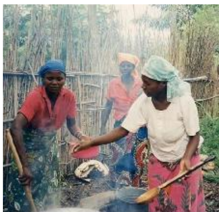
Patrinoj ĉe la Mondfondusa prinutra centro de Mboko (Sud-Kivuto, Kongio).

N un kiam la balotrajto por virinoj ekzistas de malpli ol duona jarcento, la virinoj daŭre ricevas pro samaj respondecoj inter 7 kaj 27 procentojn da salajro malpli ol viroj. Kaj la starigo en tiu lando de RTT (malpliigo de labora tempo) permesis al ili-ŝi nur dediĉi la plejmulton de la disponigita tempo al hejmaj taskoj. Vere ampleksa progreso, ĉu ne? Sed kia estus la situacio, se ne ekzistus leĝaro? Tio signifas, ke en riĉa lando kiel Francio, malgraŭ la venkoj de la lasta jarcento, la kondiĉoj por granda engaĝiĝo de virinoj en asocia vivo ankoraŭ ne komplete kuniĝis.