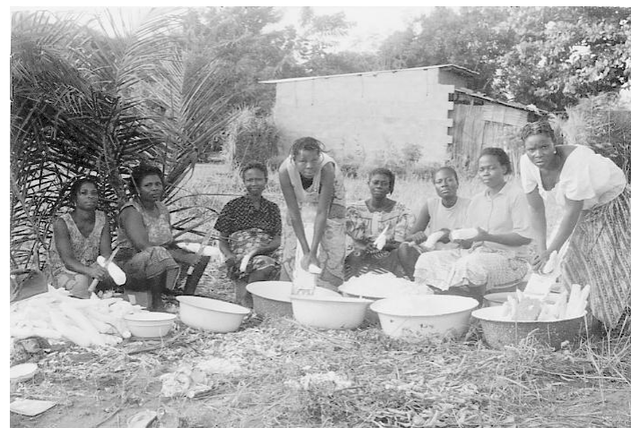
La belaj virinoj de la grupo La Kvin Fingroj tre serioze aspektas !... sed se vi sciús kiel bone ili dancas !

■ La ina grupo La Kvin Fingroj de Houéto-Fifonsi finpretigis sian helpopetan dosieron por manioka¼ejo (n°01.01.BJ). La projekto entenas la æeton de parcelo, la konstruadon de duæambra magazeno, la akiron de raspilo-premilo kaj materialon utilan por la provizado, por la funkciado de la laborejo, kaj por la vendado de la manioka¼o. La virinoj membroj de la grupo proponas sin mem kontribui per sia laboro en la starigado de la projekto : partopreno en la konstruado de la laborejo, fabrikado de korboj kaj provizado de malgranda materialo (pelvoj, marmitoj, plugpioæoj, battranæiloj), rikoltado kaj transporto de manioko. La Administra Konsilantaro de Monda Fonduso balote prikonsentis tiun financadon kaj pretigos la solidarecan kontrakton.