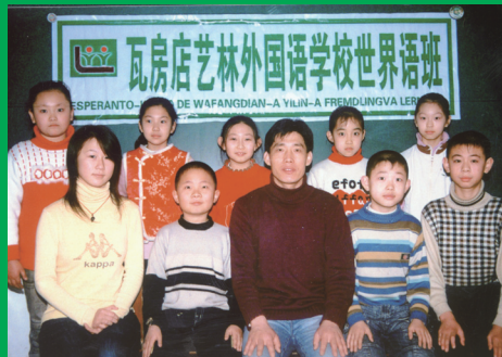
Parto de la geknaboj de la E-kurso