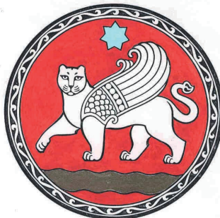
Blazono de Samarkando

En aŭgusto, 2007, urbo Samarkando oficiale kaj solene festos sian 2750-jariĝon, sub aŭspicio de UNESKO. Por celebrado la Internacia Muzeo de Paco kaj Solidaro kaj loka E-klubo kolektas gratulleterojn, vojaĝrakontojn, gazetartikolojn, poemojn, kantojn, fotojn pri Samarkando.