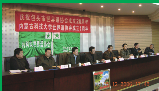
La celebra kunveno