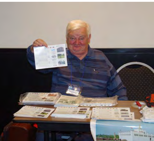
Grzegowski dum la movada foiro

Kio nepre forigendas? Kio ŝanĝendas? Jen diversaj sugestoj.