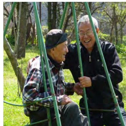
Esperanta ĉina amiko el Turkio kun kartvela gasto dum post-kunvena vojaĝo en Kaĥetio