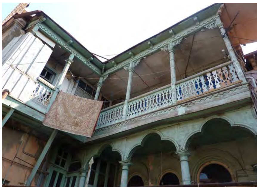
Ligna domo en Tbiliso