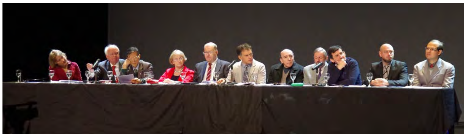
Podio inaŭgura 99a kongreso, Bonaero

Venas festparolado de la prezidanto de UEA, kiu devus entuziasmigi la partoprenantojn, kaj sproni ilin al estonta