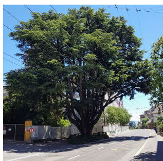
La Cedro de Beaulieu

Borde de la trotuaro de la avenuo Bergières en Laŭzano, apud Beaulieu Palaco , oni povas malkovri belegan arbon, je 20 metroj alta kun trunko da 740 centimetro periferie. Tiu majesta Libancedro ( Cedrus libani ), kiel respektinda kaj protekta