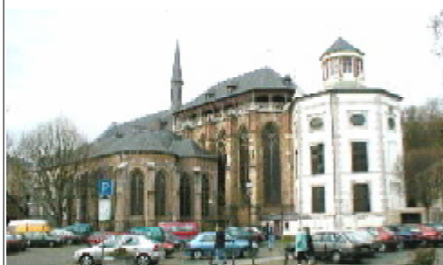
Cathédrale de Kornelimünster

A l'époque de la destruction du Temple, les querelleurs avaient enfin admis, de fort mauvais gré et avec de sombres arrière-pensées, le partage suivant : aux Avesnes le Hainaut, aux Dampierre la Flandre. Mais la guerre continuait à faire rage pour la Terre des Débats .