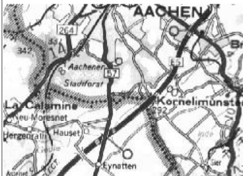
Situo de "Kornelimünster"

J e la epoko de la Templo detruo, la kverelintoj fine interkonsentis, tre malbonvole kaj kun malhelaj kaspensoj, jenan disdividon : al la Avesnes Henegovio, kaj al la Dampierre Flandrio. Sed la milito dauxre furoris pro la Tero de la Debatoj .