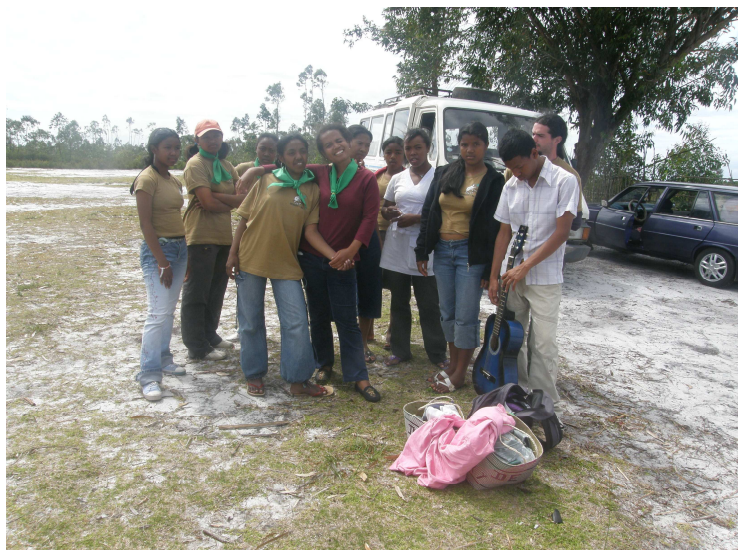
El tiuj gejunuloj ni ĉerpos novan forton por plifortigi la lokan Eo-movadon

PROSPERAN KAJ SUKCESAN NOVJARAN 2010 AL VI KAJ VIA FAMILIO !!!