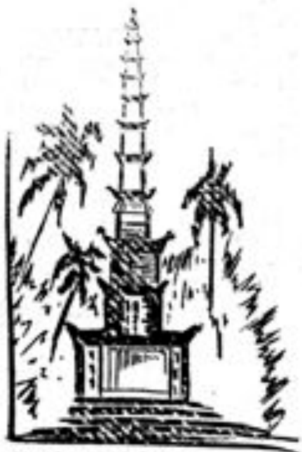
TEMPLETO - BALI

Estas ĝojo, en plena sunlumo veturi tra tiu fremda mondo. Unue la vojo serpentumas tra kaŭŝuk-, kafe- kaj rizo-plantejoj. Ambaŭflanke vidiĝas iam kaj iam malgrandaj bambuo-domoj kun indiĝenaj familioj sidantaj antaŭe; nun pli urbaj aspektoj, jen granda kazerne kun domoj por oficiroj kaj sub oficiroj; jen la malnova, indiĝena parto kun sia vigla moviĝo sur la stratoj; duradaj ĉaretoj tirataj de malgrandaj ĉevaloj kun tintiloj surdorse; tramo kun du alpendaj veturiloj, kies vandoj konsistas nur el drat-plektaĵoj kaj kiuj estas plen-plenaj de indiĝenoj; bazaroj, surstrataj vendejoj; Hindoj, Araboj, Ĉinoj, Japanoj en brilkoloraj vestoj, kontraŭ kiuj kontrastas la blankaj de la Eŭropanoj kaj Amerikanoj. Meze en la ĉefstrato mallarĝaj kanaloj, en kiuj virinoj purigas tolaĵon aŭ eĉ banas sin. Ni renkontas funebran procesion: la ĉerko, kovrita per koloraj tukoj, kuŝas sur stangoj, kiuj viroj portas sur ŝultre, la funebrantoj sekvas piede.