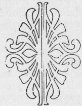
El Moravia Karsto

Laca silento... Falas velkintaj folioj... Siblas tremvoĉe florenterigaj arioj... La tri fratinoj sidas... kaj sidas rigide... Plendoj korfundaj ploras, ĝemflugas senbride.