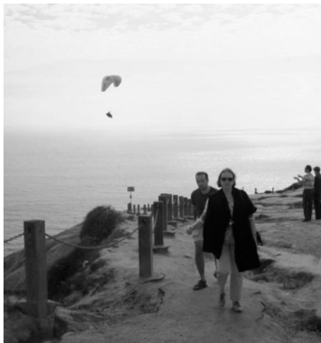
NASKanoj esploras la klifojn apud la glisejo.