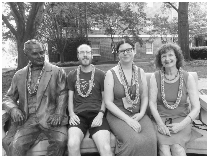
Rezulto de la leifarado

Purpure, ĉar eksterteranoj ne portas ĉapelojn.