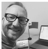
"Meta-foto": Brajeno prilaboras tiun ĉi numeron de la Fasko

Ĉi-vespere je la 7-a horo okazos "interkonatiĝa vespero" en la dua etaĝo de la konstruaĵo Main (#1 sur la mapo). Tio estos okazo por neformale babili kun la aliaj lernantoj kaj la instruistoj.