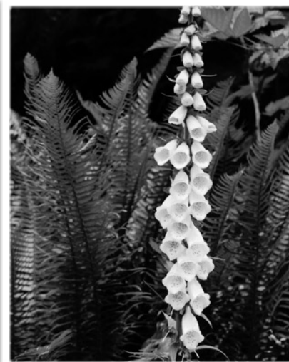
Notu: jen vera digitalo : herbo en la genro Digitalis . Rilate al komputiloj, pli taŭga vorto estas cifereca .