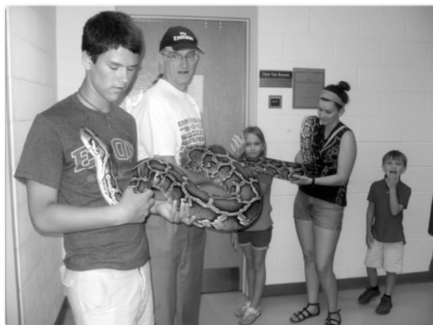
Familianoj kun “Karmalita” (Burma pitono)

Ni havis okazon “koni” iujn el la bestoj de lia laborloko. Jen foto, supre!