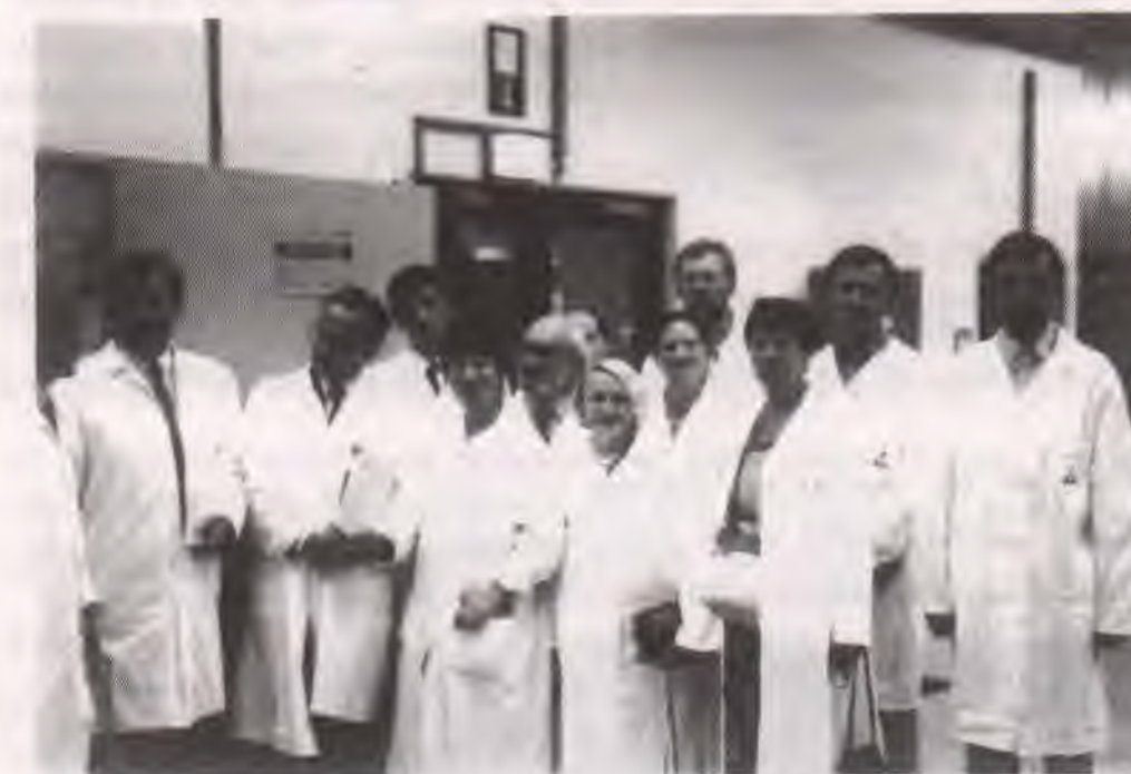
Dum la fabrikrigardado ĉe Siemens; Gvidantoj de Siemens kaj parto de la vizitantoj.