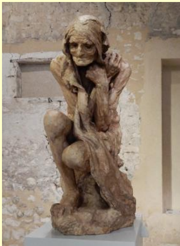
Kelkaj skulptaĵoj fare de Jules Desbois