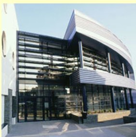
La kvartaldomo « Les Trois-Mâts »

La kvartala domo "Le 3-Mâts" (la trimastulo) en la anĝeva kvartalo "Les Justices" organizis dum du semajnoj diversajn kunvenojn kaj atelierojn favore al la loĝantoj, pri lingvoj kaj diferencoj. Nia grupo estis invitita por konigi la internacian lingvon Esperanto. Sabaton la 10-an de februaro 2018, tri membroj el nia asocio faris prezenton al kelkaj publikanoj, tamen tre interesataj. Interalie, paro venis kun sia infano, dekjaraĝa lernanto. Kune, post tiu prezentado kaj respondoj al diversaj demandoj, ni amuziĝis per ludkartoj, "memory" (ludo famkonata kaj adaptita por la esperanta lingvo). La infano gaje akceptis skribi mem, laŭ sia elekto, diversajn vortojn sur verdan balonon kiun li forprenis kiel donacon.