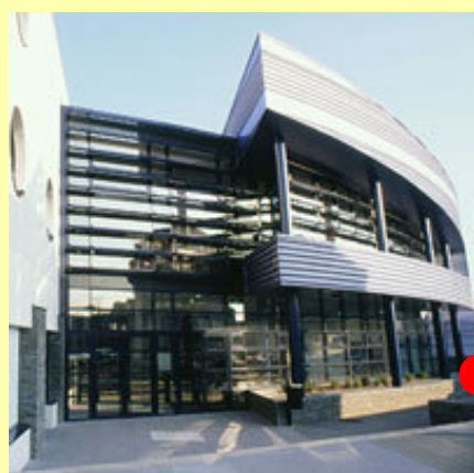
La kvartaldomo "Le Trois-Mâts"

"Cabaret du monde" Vespero pri la temo de la lingvoj (por plenkreskuloj, oni enskribiĝu) kun partopreno de Esperanto-Angers