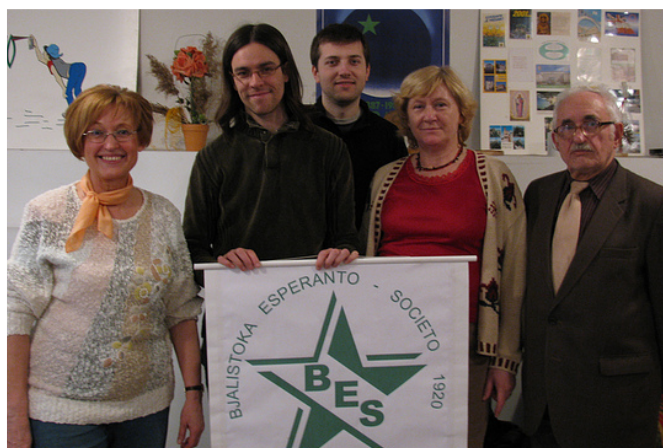
Esperantistoj en Bjalistoko

ESPERANTO-KULTUR-CENTRO DE TULUZO Centre Culturel Espéranto de Toulouse 31, rue Franc 31000 Toulouse Tél. : 05 61 62 39 48 — 06 31 68 00 26 esperanto.toulouse@free.fr http://esperanto.toulouse.free.fr