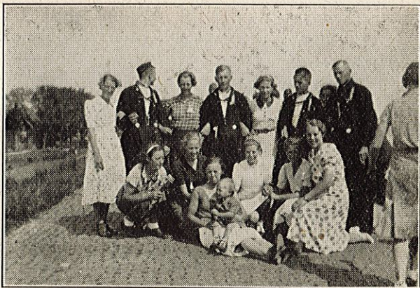
Partoprenantoj de la 1-a internacia Junularkunveno en Groet en 1938, kiuj dum la ekskurso al Volendam interamikiĝis kun Volendamanoj!