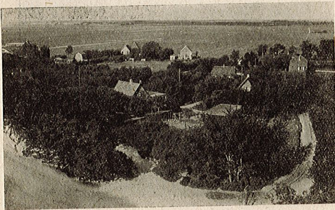
Panoramo de Groet (Nederlando).

Jen bonaj novaĵoj: Ni sukcesis lui ŝipon, per kiu ni faros grandan ekskurson tra la provinco Nord-Holando. Ni planis jenan ekskurson: De Schoorldam per la ŝipo al Alkmaar, promenado tra la urbo, kaj poste ni veturos laŭ la Nord-holanda kanalo al Purmerend. De tie, ĉirkaŭ la poldero De Purmer, al Edam., kie ne tranoktos. Parte ĉe samideanoj, kaj parte en la ŝipo. Ni rigardos Edam kaj promenos al Volendam. Vespere ni aranĝos festvesperon (la partoprenantoj mem prizorgu ĝin!). La sekvontan tagon ni ŝipveturos de Edam, preter Monnikendam kaj Broek in Waterland al Amsterdamo, kie ni rigardos kelkajn vidindaĵojn. Poste ni reveturos laŭ la pentrinda Zaan-regiono al Schoorl. — Ĉu ne alloga ekskurso?