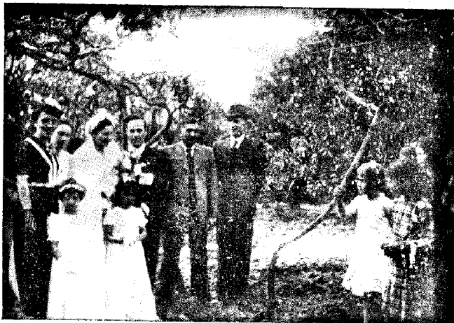
La geedziĝ-festo de niaj portugalaj geamikoj.

.... Jes, kara amikino, ankaŭ mi kredas ke iun tagon ĉiuj homoj komprenos, ke ili estas inteligentaj, kaj ne sovaĝaj bestoj. Malfeliĉe ili ankoraŭ ne komprenis tion. .... Respondante al via demando mi informas vin, ke mia edzino ankaŭ estas esperantistino. Mi lernigis al ŝi iom de nia lingvo. Malgraŭ tio ke