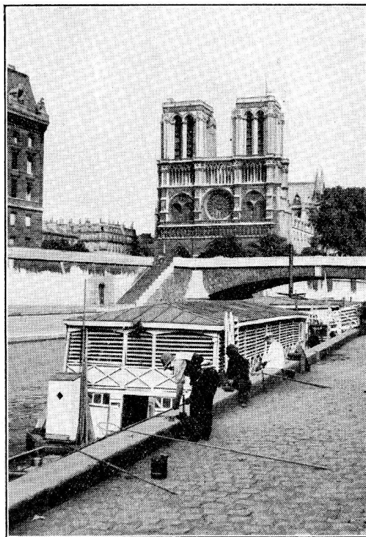
LA KATEDRALO NOTRE-DAME KAJ KAJOJ DE LA RIVERO SEINE

Ni lasu je nia dekstra flanko la florvendejon, kie ĉfumatene (en 1793) la