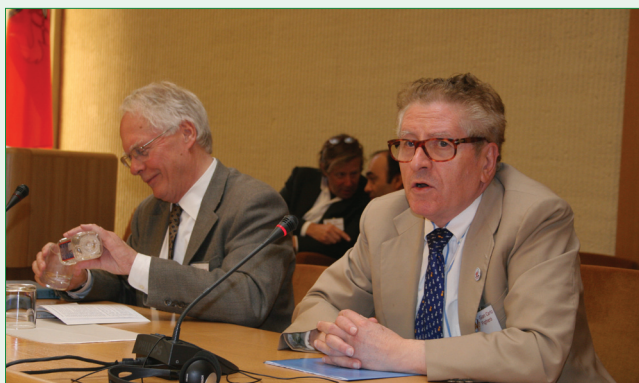
"Nova rekordo de la Esperanto-movado: pli da prelegantoj ol partoprenantoj!"