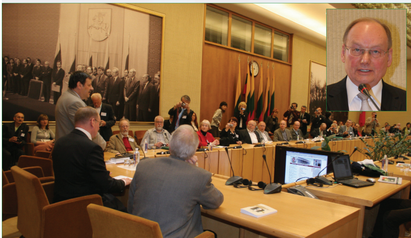
La parlamenta prezidanto Ĉeslovas Jurŝenas salutas nian kongreson.

Niaj kongreslaboroj hieraŭ okazis en la historia loko, la litova parlamentejo. Ĝia Konstituta Salono estas plena de litovaj kuraĝoj por la sendependiĝo. Tio influu al nia esperantista ĵurnalista movado.