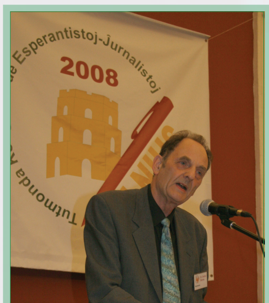
Ĉu ni iom levis (rektigis) la Esperanto-ĵurnalismon?