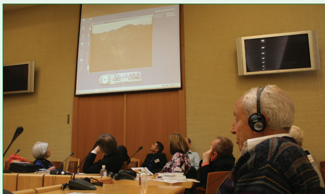
Ĉi tiu foto ne atestas, ke nia kongreso havis interpretistojn.