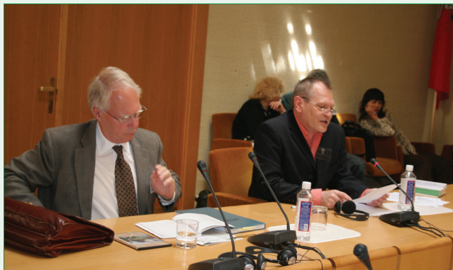
"H.T. sukcesis produkti malgrandan guton."