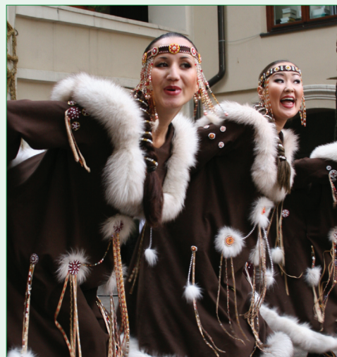
Fotoj: "Sonas Sonas Kankloj en 2006"