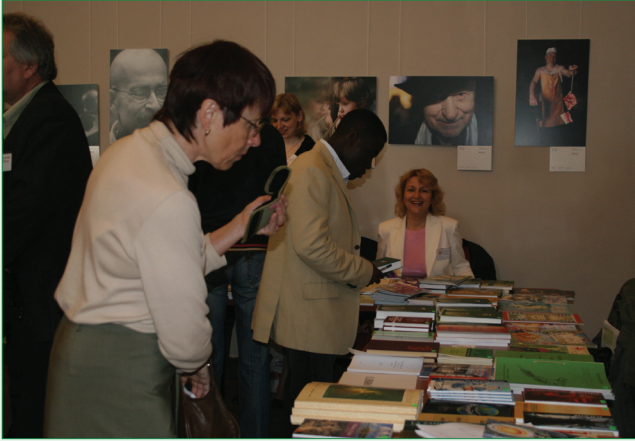
Libroservo funkcias antaŭ la ĉefsalono de la Malnova Urbodomo.