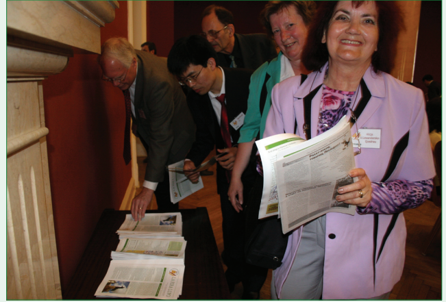
Kongresanoj ekĝojis ĉe la unua numero de la kongresa ĉiutaga informilo "La Fera Lupo".