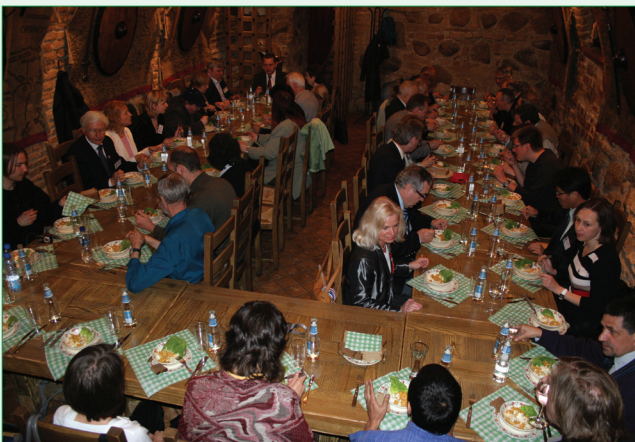
Longis tagmanĝo pro tro da kelerinoj nomitaj "Mokinè" (lernantino). Do okazis "Interkona Tago".