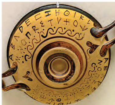
Arkaika greka alfabeto. Nacia Arkeologia Muzeo de Ateno