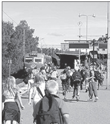
Nur 20 minuta trajnovojaĝo de la centra stacidomo de Stokholmo venigos vin al la kongresa loko

Proponoj por la jarkunveno de Sveda Esperanto-Federacio devas atingi la estraron antaŭ la fino de februaro (adreso de SEF, vidu p. 2 de tiu ĉi gazeto).