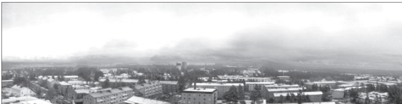
Panoramo el la supro de la komunuma domo de Haninge

En 2005 la jarkongreso de Sveda Esperanto-Federacio okazos en Haninge, proksime de Stokholmo, sabate la 14-an kaj dimanĉe la 15-an de majo. Estos ebleco partopreni programon ankaŭ en la vespero de vendredo la 13-an de majo, en Esperanto-Centro en Stokholmo.