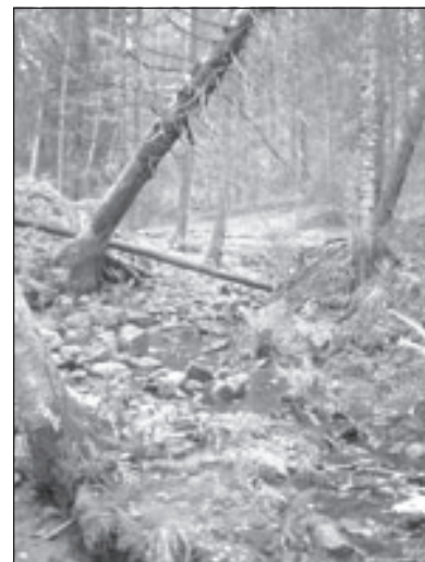
Tra la komunumoj de Haninge kaj Tyresö etendiĝas la nacia parko de Tyresta, vera sovaĝejo en tuja proksimeco de la ĉefurbo

en Handen/Haninge (Park Inn), kaj ankaŭ pri hoteloj en Stokholmo, kiuj situas proksime de la loka trajnlinio (pendeltåg) al Haninge. La programo okazos je tiaj horoj, ke eblas loĝi en Stokholmo por tiuj kiuj preferas tion.