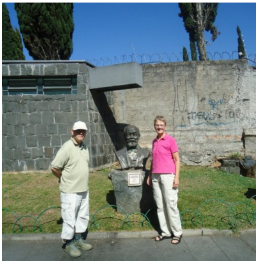
En Kuritibo ni salutis Dr'n Zamenhof