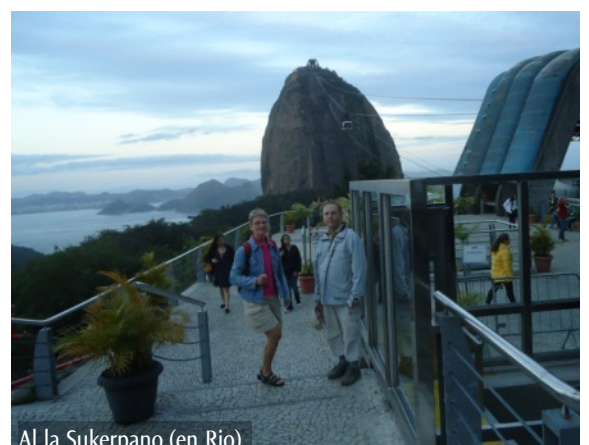
Al la Sukerpano (en Rio)