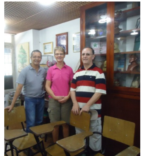
En Kultura Kooperativo de Esperantistoj (Rio)