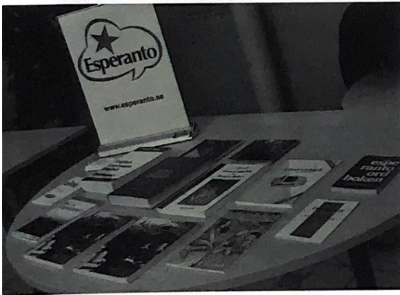
Esperantobordet på språkcaféet i Nacka.

I samband med invigningen av utställningen "Språken i mitt liv" den 14 oktober, där tävlingsbidragen från affischtävlingen till Europeiska språkdagen 2010 visades, hölls ett litet språkcafé på Internationella Barnkonstmuseet i Vårby gård. Linus Ganman och Olof Pettersson berättade om esperanto, svarade på frågor och visade böcker för besökarna som huvudsakligen bestod av skolorngdomar. Några provade även att lära sig en fras eller två.