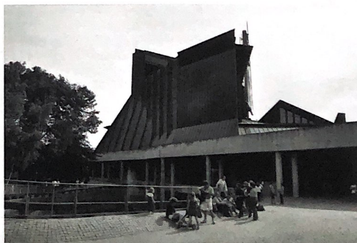
Ekster la Vasa-muzeo.