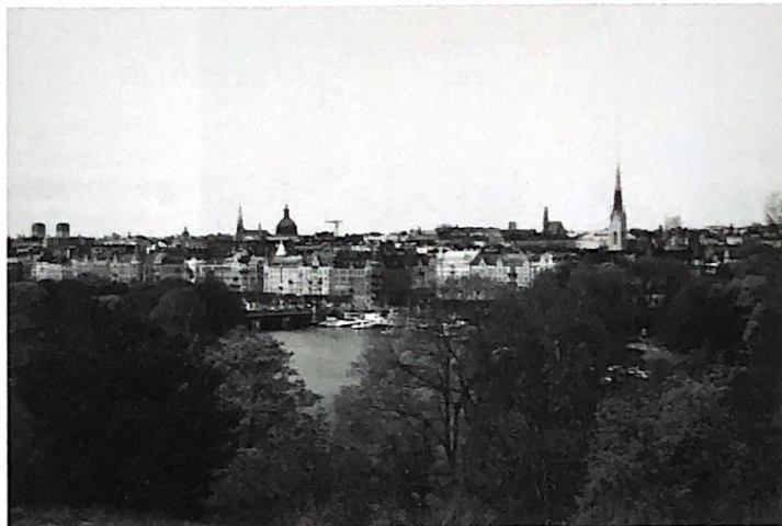
Utsikt från Skansen mot Östermalm.

Luncherna på lördagen och söndagen består av färdiga salladspaket med bröd, smör och lättöl eller mineralvatten, och serveras i Cybergymnasiets mat-