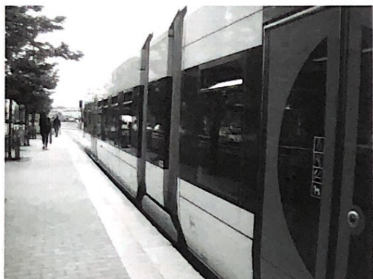
La Tvärbanan tramo en Stockholm.