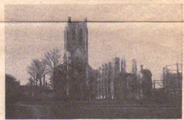
Abatejo de Saint-Bertin Ruinoj de la preĝejo : XV a jarcento

La turo Saint Bertin, ruino de la antikva tiel nomita abatejo estas unu el la plej vidindaj monumentoj.