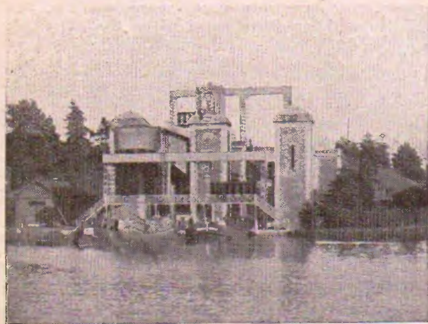
Siplevelego de Fontinettes

Multnombraj estas la ekskursoj farindaj ĉirkaŭ Saint-Omer : la arbaro de Clairmarais kun la ruinoj de la antikva abatejo, Arques kun la ŝiplevelego de Fontinettes, la valo de Aa kun siaj kasteloj kaj uzinoj.