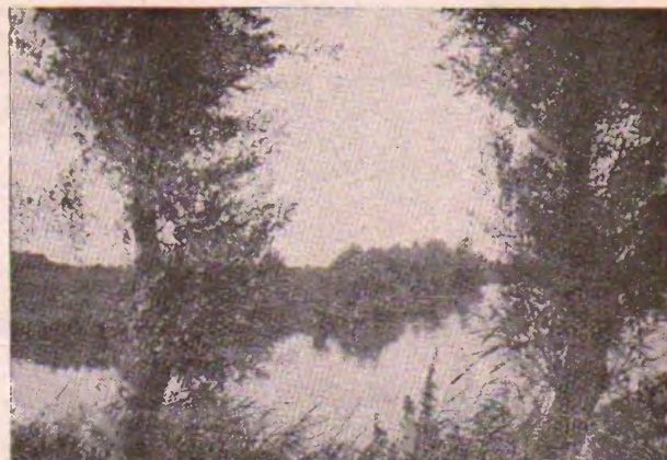
Vidajo en la Norda Venezio

La fiŝkaptado ankaŭ havas siajn adeptojn. Riveroj, kanaletoj, lagetoj estas ĉiutage trairataj de miloj da fiŝkaptistoj venantaj el ĉiuj partoj de la regiono. La arbaro de Clairmarais, iam posedaĵo de la monaĥoj de Saint-Bertin, enhavas grandajn lagojn kiuj, forlasataj de post la Franca Revolucio ĝis la lastaj jaroj, estis nur vasta kampo de kanoj,