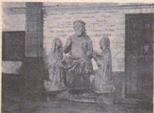
La « Granda Dio » de Théroutanne (XV a jarcento)

Venu do multaj al ni por instruiĝi, ripozi, promeni, amuziĝi. Vi estos akceptataj laŭ la malnova franca kutimo kaj vi fariĝos tiel viavice niaj plej bonaj agentoj de propagando.