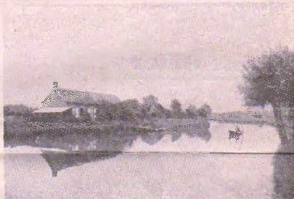
« Norda-Venetio »

Ĉirkaŭbarita ĉiuflanke de la rivero Aa, ĉirkaŭita de la multegaj kanaletoj, la multaj riveroj, kanaloj, lagetoj kaj marĉoj, kiuj nomigis ĝin la franca Bruges, ĝi vere estas Norda Venetio, kie ĉiudimanche la promenantoj alkuras por viziti ĝiajn pentrindajn pejzaĝojn kaj ĝui ilian tiel interesegan ĉarmon. En tiu iama golfo de la Norda Maro, longa