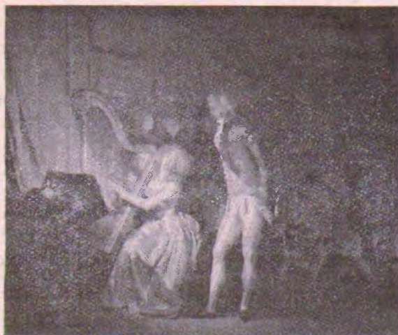
Improvizita Koncerto, de L.-L. Boilly

de armiloj, kunmetita el kirasoj, spadoj, kaskoj, ponardoj de la dekdua ĝis la dekoka jarcento, argilaĵoj, ceramiko, medaloj, moneroj el la plej malproksimaj epokoj de nia historio.