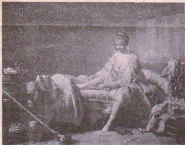
La Leviĝo de Fanchon, de N.-B. Lépicier

de armiloj, kunmetita el kirasoj, spadoj, kaskoj, ponardoj de la dekdua ĝis la dekoka jarcento, argilaĵoj, ceramiko, medaloj, moneroj el la plej malproksimaj epokoj de nia historio.