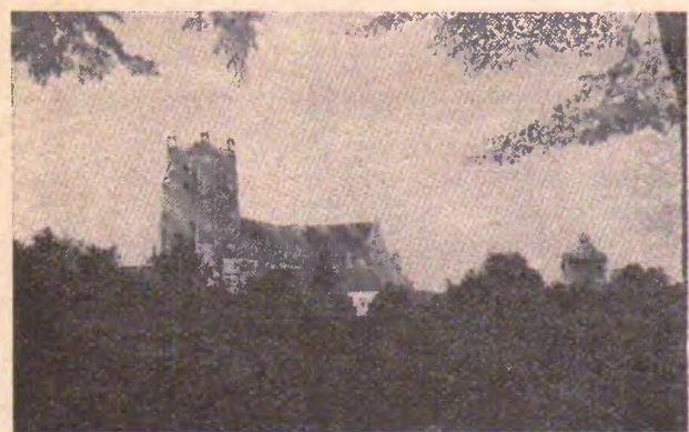
La baziliko « Nia Sinjorino »

Ĝia baziliko « nia Sinjorino » situata sur la loko de la antikva Sithiu, estas mirindaĵo de la gota arto.