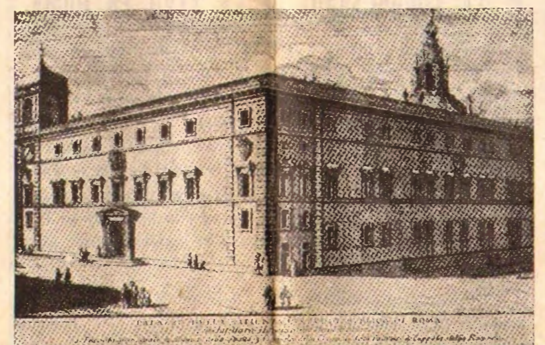
Antikva gravuraĵo pri la Palaco de la Universitato de Roma sidejo de la XXVII a

Pertanto ha indetto un «Corso teorico-pratico di lingua ausiliaria esperanto», completamente gratuito, per ferrovieri e familiari, che si svolgerà in tutti i martedì, giovedì e sabato, dal 16 aprile a tutto giugno p. v., dalle ore 20 alle 21, nei locali del Dopolavoro ferroviario, in via Milano al Vasto. Il