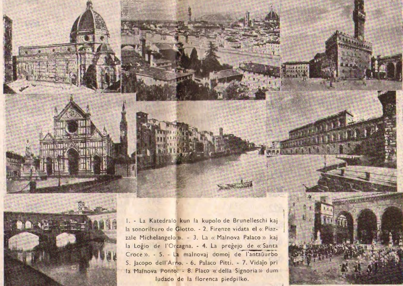
1. - La Katedralo kun la kupolo de Brunelleschi kaj la sonorituro de Giotto. - 2. Firenze vidata el « Piazzale Michelangelo ». - 3. La « Malnova Palaco » kaj la Logio de l'Orcaĝna. - 4. La preĝejo de « Santa Croce ». - 5. - La malnovaj domoj de l'antaŭurbo S. Jacopo dell'Arno. - 6. Palaco Pitti. - 7. Vidajo pri la Malnova Ponto. - 8. Placo « della Signoria » dum ludado de la florenca piedpiko.