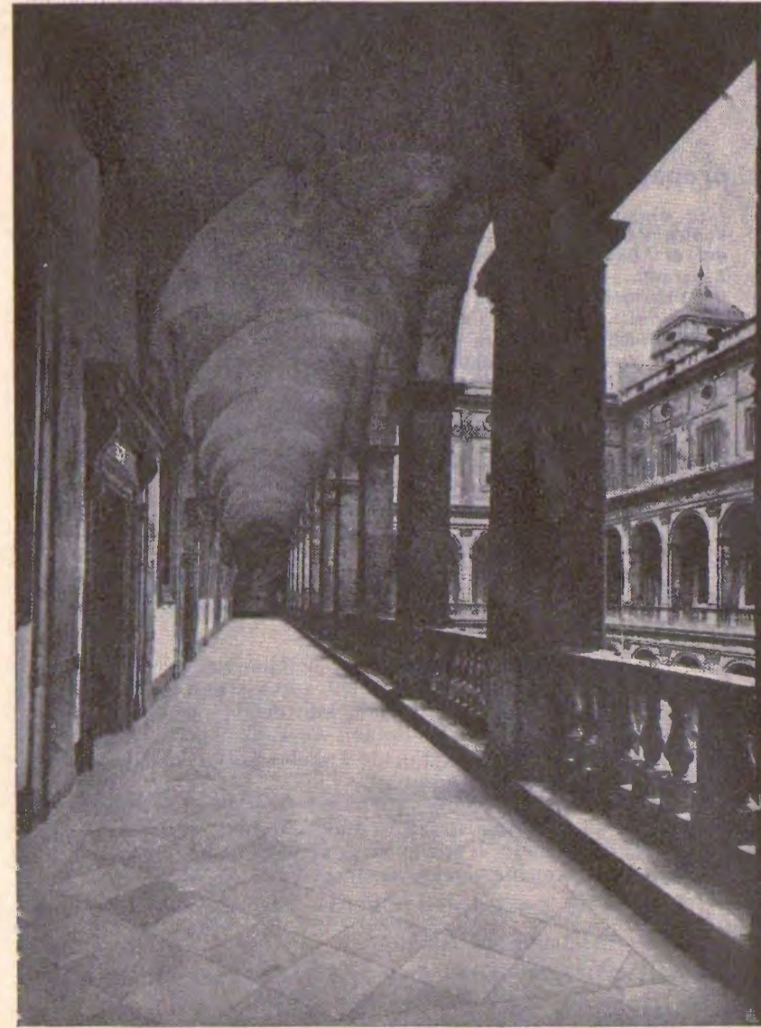
EN LA KONGRESEJO DE LA 27 a

Ni sekve petas, ke oni ne plendu ĉe ni pri malsameco de la kotizoj en liroj, respektive frankoj, pro komparo de la du tabeloj, koncerne valuto-kurzon, ktp. - Oni atentu ke la prezoj en italaj liroj ne estas