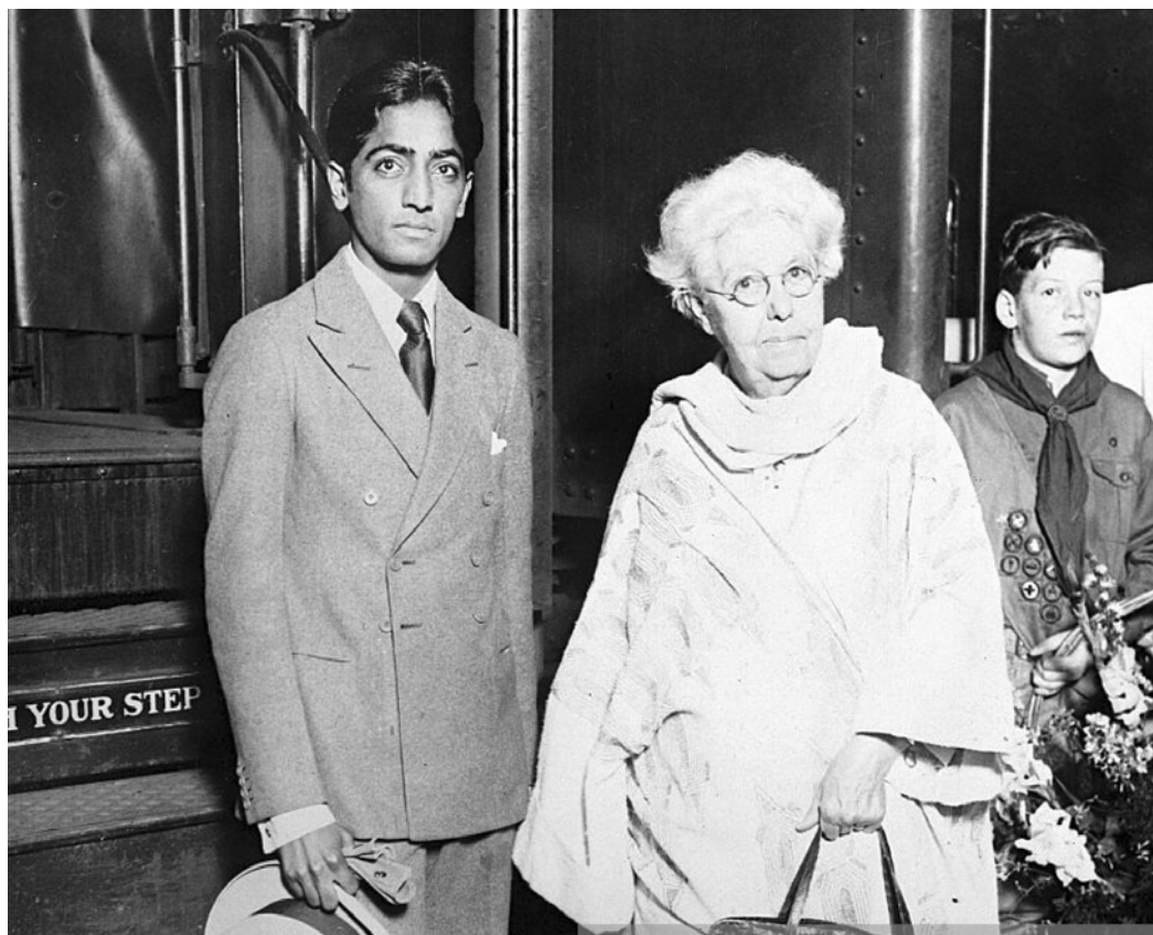
Krishnamurti kaj Annie Besant

konataj teozofoj. La nomo Alcyone estis donita al Kriŝnamurti, kiam li 14-jara knabo verkis la libron Ĉe la piedoj de la Majstro , eldonita sub la kaŝnomo Alcyone. Leadbeater skribas: “La libro Ĉe la piedoj de la Majstro estas al ni la plej bona kaj plej valora libro ĉi-momente. Tiu libro reprezentas pli specife la Instruon de la Mondinstruisto, la Venonto, Lordo Majtrejo, la Bodhisatvo.”