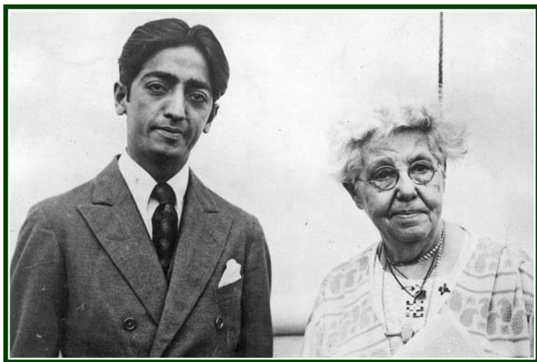
Kriŝnamurti kaj aĝiĝinta Annie Besant