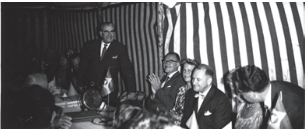
Dum sia parolado Martinus dankas al ĉiuj pro apogo, helpemo kaj donacoj.

Ja estas necese, ke la militoj kaj ĉi tiaj aferoj povos finludi sian rolon. Tio, kion ni nuntempe spertas, estas la sinmortigo de la militoj. Estas vere, ke venos tre peza tempo denove. La milito ankoraŭ ne atingis sian finon. Sed tiu ĉi milito estos la sinmortigo de la militoj, kaj ĝi ja ne trafos la homojn, kiuj ekhavas la diecan staton; kiuj enkondukas tiujn ĉi pensospecojn de la luma epoko en sian menson. Tiu stato havas la plej grandan protektopovon, ĉar nek