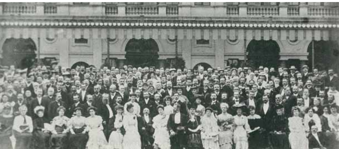
Kongresanaro en la unua kongreso 1905, Bulonjo sur Maro

Nova monda kulturo naskiĝos sur la Tero. Esperanto estas parto de tiu nova kulturo. Oni diras ke Esperanto estas la