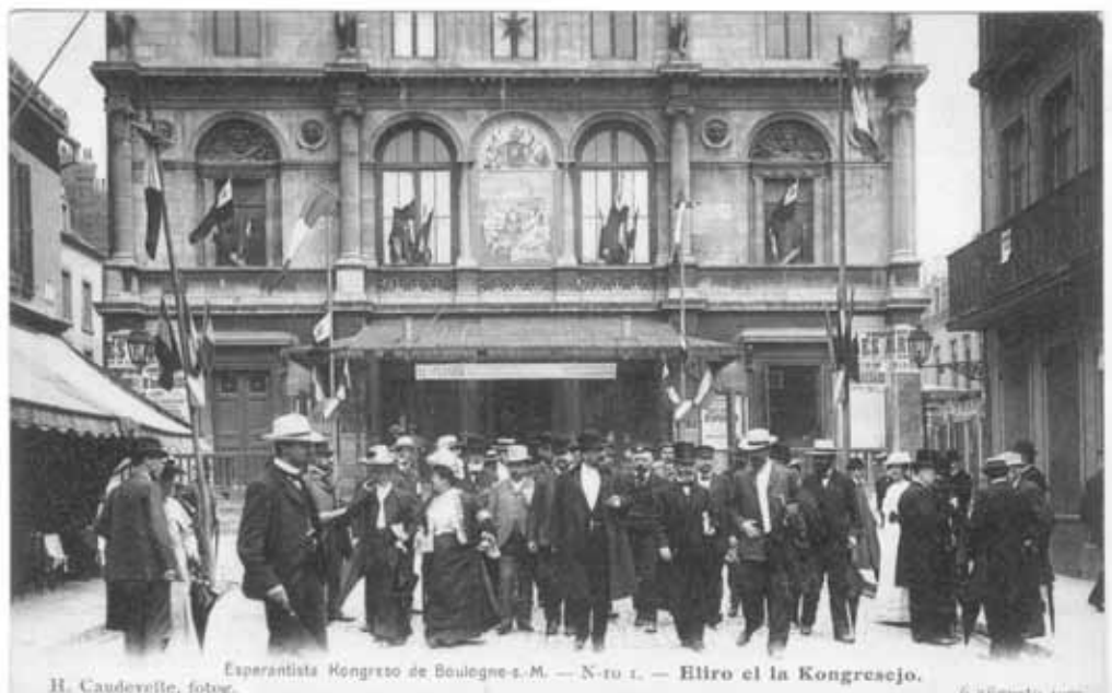
Eliro el la kongresejo en Bulonjo sur Maro en 1905