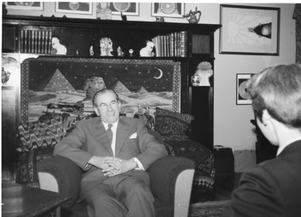
La memorĉambroj de Martinus La sidĉambro de Martinus, kiu hodiaŭ estas muzeo

skribaĵo de la mortinto, kiam la malnova cave à lampe estos liberigita pri sia kovraĵo, kiam la leĝo estos provita de la reĝo kaj la ulpana princo, la reĝa domo kaj la gvidanto venos sub la glazuron". (KPN, paĝo 154).