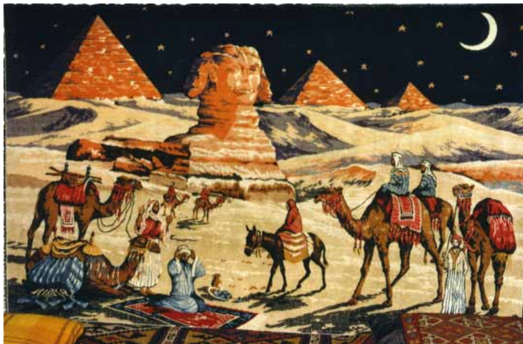
Murtapiŝo kun la sfinkso kaj la piramidoj en la sidĉambro de Martinus

2009-2034 ankaŭ penetros ĉe la ne-kristanoj kaj kondukos al paco kaj konkordo sur la tuta tero. Billenstein do opinias ke la islamanoj tiutempe ankaŭ komencos alpreni la novan kredon, kiu kontribuu al la kreo de paco. (KPN, paĝo 86).