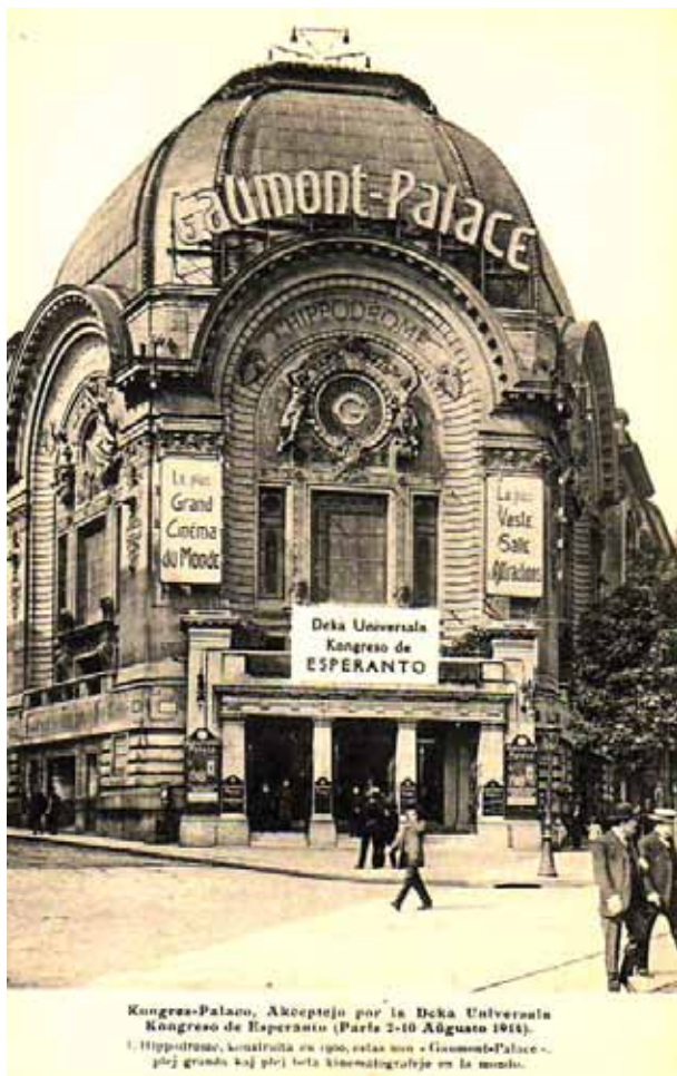
Bildkarto kun reklamo de la 10-a Universala Kongreso montras la antaŭviditan kongresejon, Gaumont Palace en Parizo, ĉe la angulo de rue Caulaincourt et rue Forest, proksime al Place Clichy en la 18-a arrondissement. – Aliĝis 3700 Esperantistoj por la evento, inter ili 2500 eksterlandanoj. La aranĝo estis modele preparita. Karavanoj de rusoj, germanoj, angloj jam forvojaĝis, kaj alveninte al Parizo la 1-an de aŭgusto. – Oni mal-konstruis “Palaco Gaumont” en 1972 por la konstruado de hotelo, kiu situas proksime al Place Clichy.

Provizitaj de la konsulo de pasporto, kiu estis subskribota de la hotelestro kaj de la polikomisaro, ni iris al la prefekto por ricevi nian permeson de restado. La kontoroj, al kiu miaj tri kunvojaĝantinoj kaj mi devis iri, provizore estis aranĝita en lernejo, kiu staras en mallarĝa strato. Tie ĉi staris homoj centope el ĉiuj nacioj, eŭropanoj kaj homoj el aliaj mondopartoj; ni staris sur la trotuaro ekster la lernejo sen sufiĉaj kontrolistoj. En la prefektejo oni laboris treege malrapide, kaj post 6 horoj ni nur avancis mallonge, tiam unu el la danaj sinjorinoj svenis; kaj dum bonfaremaj homoj sur la alia flanko de la strato helpis ŝin, mi iris al la konsulo por rakonti al li, kiel malfeliĉaj ni estas. Mi demandis, kio povus okazi, se ni ne ricevus la permeson de restado, kaj li respondis, ke estas absolute necese, ke ni ĝin havu, ĉar se ne, estus neeble por ni forlasi la landon, kaj oni eĉ volos aresti nin. Nu, ni do la proksiman matenon ekde la 6-a horo laŭvice atendadis; tiun ĉi tagon la kontoro translokiĝis al pli freŝa strato, sed ankaŭ tie ĉi estis nur tre malmultaj kontrolistoj kaj centoj da fremduloj; ankaŭ tie ĉi nur treege malrapide oni avancis.