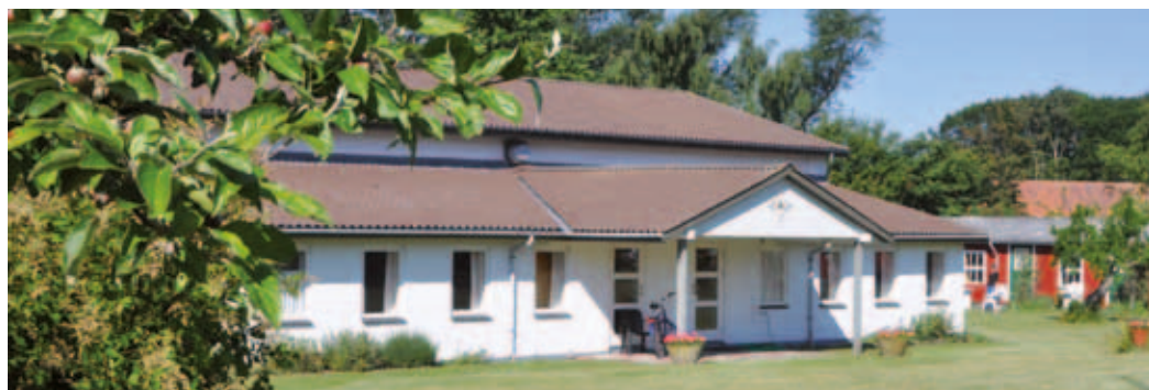
La prelegejo en Klint

Vidu informojn pri kursoj kaj aliĝo ĉe www.martinus.dk , aŭ mendu la kursoprogramon ĉe Martinus-Instituto