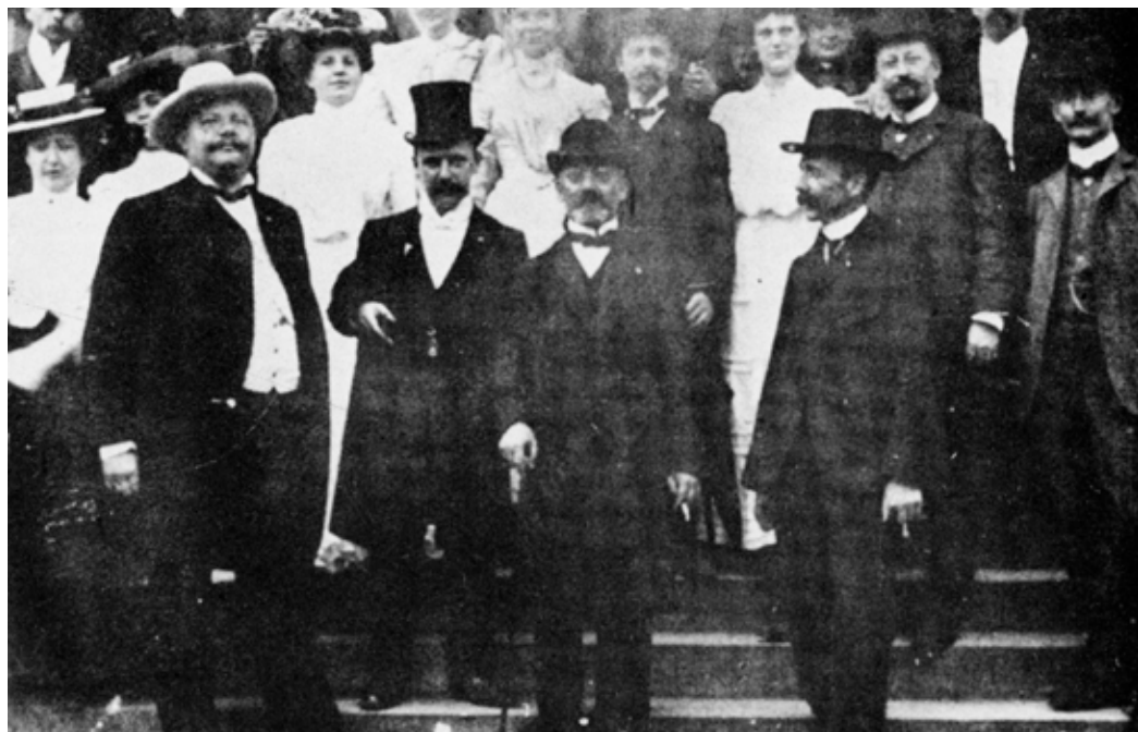
Zamenhof inter esperantistoj en Frankfurt, 1906

La juna studento Zamenhof, en 1881-2 – la jaroj de la kontraŭjudaj pogromoj – estis ekscitita kaj enprofundiĝis en la demandon kiel savi la judojn. En la komenco li subtenis la ideon, ke la orienteŭropaj judoj devas elmigri Amerikon. Li aperigis grandan artikolon en la ruslingva juda gazeto Razsvet , klopodante konvinki la judojn elmigri Usonon. La lasta frazo de la artikolo estis: “Ĝis revido, mia popolo, en la propra ĥato, sur la liberaj bordoj de Misisipo!” Sed ĉar sekvis je tiu ĉi alvoko de Zamenhof multaj akraj engazetaj kritikoj, li sufiĉe rapide ŝanĝis sian opinion kaj fariĝis... Cionisto. Li do tuj poste aperigis en la sama gazeto alian grandan artikolon, en kiu li vokis por enmigrado al Palestino. Zamenhof fariĝis tiam tre