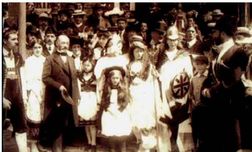
Zamenhof kaj urbestro en Cambridge, 1907