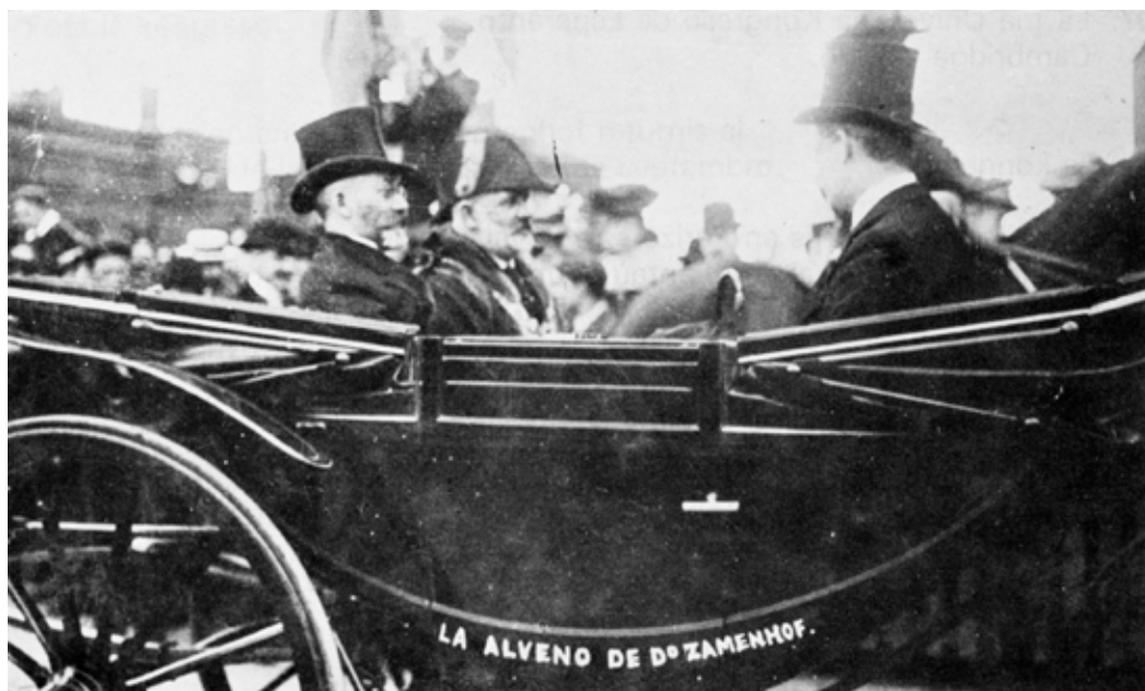
Zamenhof kaj urbestro en Cambridge, 1907