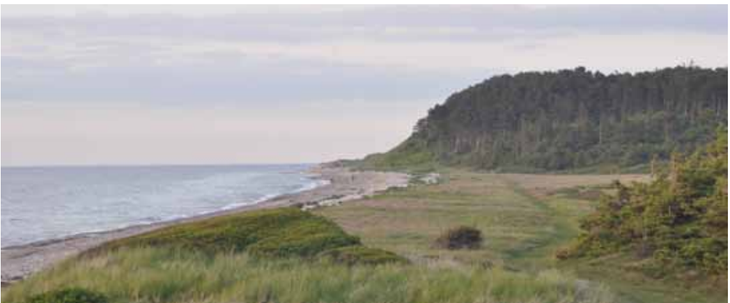
Strando ĉe Klintebjerg, majo 2009

Librovendejo Editura Mix, Str. Fdt. Harnulului 20/B/12, RO-2200 Brasov, Rumanio. www.edituramix.ro, contact@edituramix.ro. Vidu la Martinus-libron en la fenestro.