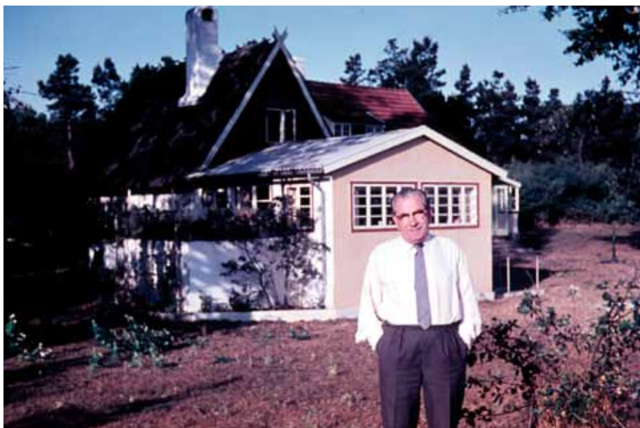
Martinus en 1953 antaŭ Vilao Rosenberg en Klint, kie li loĝis dum la someroj 1937-1981