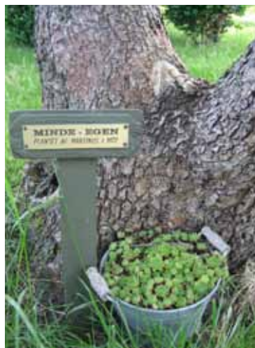
Memora kverko plantita de Martinus en 1972.