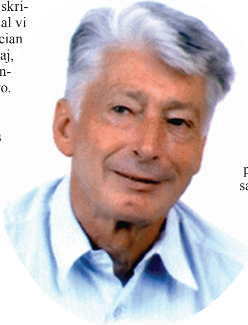
Claude Piron 1931-2008

La lingvaĵo en "Tien" estas sufiĉe facila en tiu maniero ke ĉefe kutimaj radikoj estas uzataj. Samtempe ĝi iel estas nefacila kaj eksterordinara. Por mi estas ĝuo legi tekston kun tiom da elegantaj vortkombinoj kaj trafaj esprimoj kiel en la libroj de Piron.