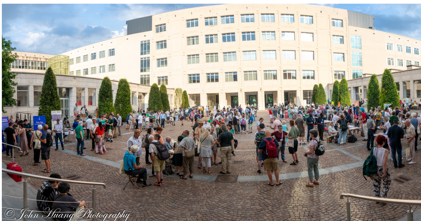
La movada foiro