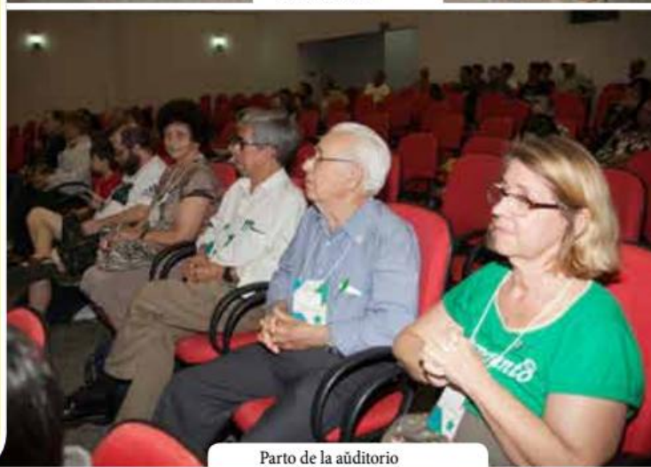
Parto de la aŭditorio