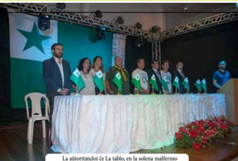
La aŭtoritatuloj ĉe La tablo, en la solena malfermo