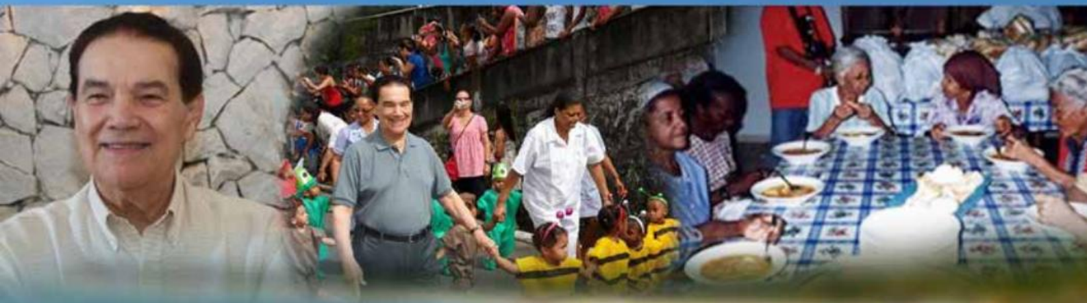
La mediumo, oratoro kaj verkisto Divaldo Pereira Franco

Ke la ekzemplo de tiu senkompara kristanlaboranto prilumu kaj kuraĝigu pli da homoj labori sur la kampo de la bonfarado, konforme al la instruoj de la konsolanta Doktrino de la Spiritoj kaj ĉefe al la faroj de Jesuo-Kristo, kiam estis ĉe ni!