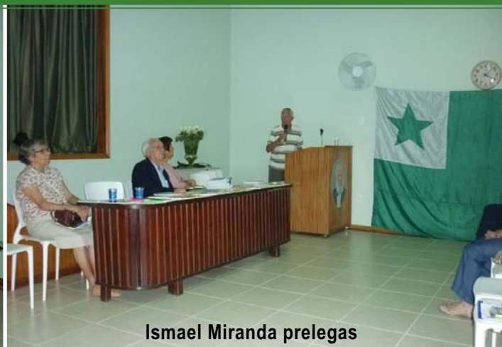
Ismael Miranda prelegas