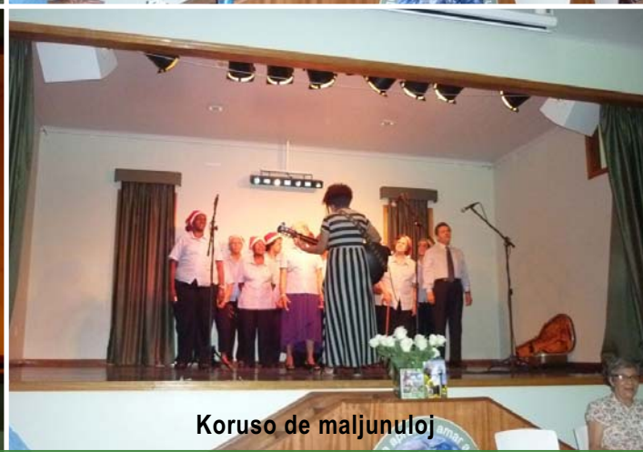
Koruso de maljunuloj

La Estraro de Lorenz dankas al ĉiuj kunlaborantoj, amikoj kaj samideanoj, ke dum tiel longa periodo vere subtenis nian Eldonejon. Dio benu vin ĉiujn!