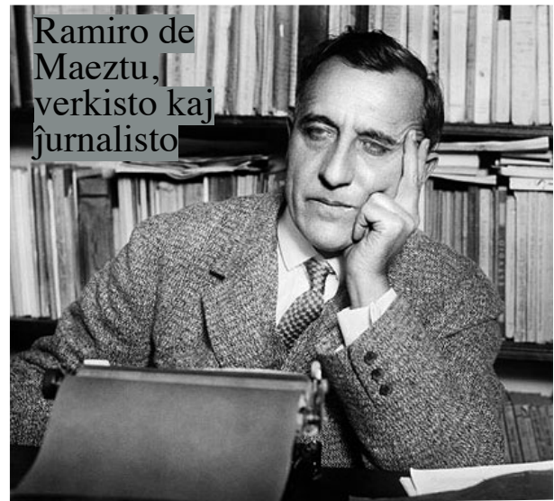
Ramiro de Maeztu, verkisto kaj ĵurnalisto

La principoj devas veni unue, ĉar la komenco, laŭ la Akademio, estas la unua momento de esti de afero. La formulo de "politique d'abord" ne iras kun ni, krom se oni komprenas, ke la unua afero en politiko devas esti la starigo de principoj. Kvankam ni kredas je la esenceco de la formoj de registaro, ni ankaŭ ne preferas ilin al iliaj normigaj principoj. Ni havas la pruvon en tiu 18-a jarcento, en kiu la hispaneco estis perdita por ni. La institucioj provis simili tiujn de 1600. Ekzistis eĉ pliiĝo en la potenco de la krono. Sed ni estis regataj en la dua duono de la jarcento de aristokrataj framaso-