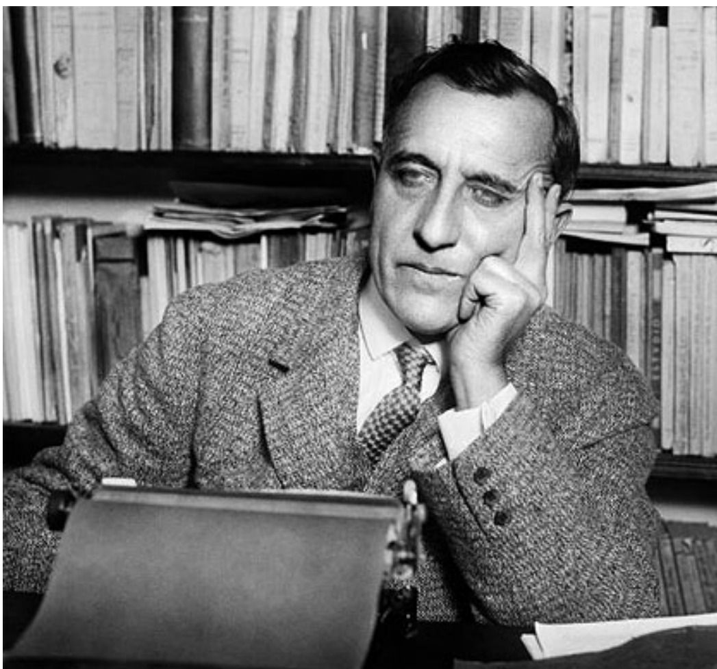
Ramiro de Maeztu

de tago al tago, sen idealo, almenaŭ sen idealo, kiun la tuta mondo devas danki al ili. Kaj ĉu la nesufiĉa solidareco de la hispanaj popoloj ne dependos de tio, ke ili permesis, ke siaj komunaj historiaj valoroj velkas kaj forvelkis? Kaj ĉu tio ne ankaŭ estas la kaŭzo de la manko de originaleco? Ĉu originalo ne estas denaska?