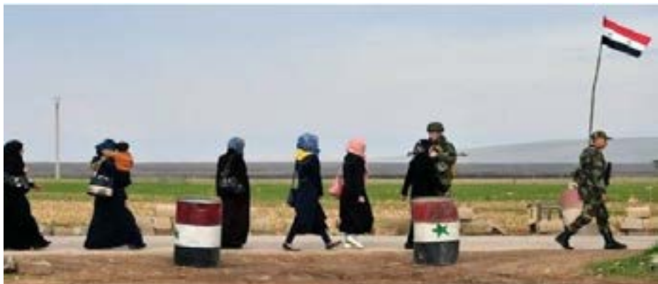
Civiluloj eliras el sieĝita urbo en Sirio, sub la rigardo de sieĝanta armeo

Tamen, ekzistas ekzemploj pri kontraŭaj militaj aktoj. Tiel, okaze de la hispan-usona milito en la insulo Kubo en la jaro 1898, la usona armeo permesis la eliron de civiluloj antaŭ ol bombardi la urbon Santjago. Same, japanoj, dum la rus-japana milito en la jaro 1905, proponis la eliron de ne-kombatantoj el la urbo Port Arthur. Do, kvankam verdire temis pri antikva kaj akceptata strategio, ekde la komenco de la 20-a jarcento oni permesas kaj eĉ faciligas la eliron de civiluloj el sieĝitaj urboj fare de la sieĝanta armeo. La proceso mem kontraŭ la marŝalo von Leeb kiu ne efektivigis tiun akton, kvankam fine absoluta, estas pruvo, ke temas pri akceptata praktiko en la lastatempaj militoj.