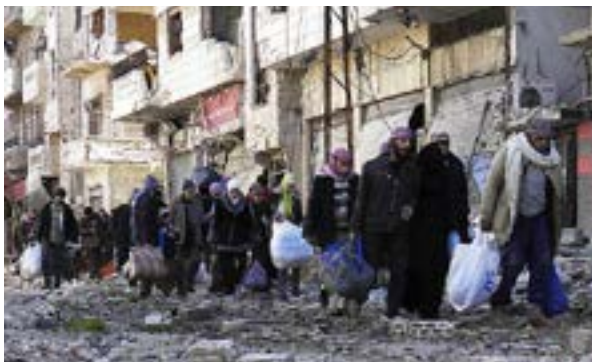
Civiluloj en la milito de Sirio

Same, la artikolo 23-a de la Ĝeneva Konvencio Celanta Mildigi la Situacion de Vunditoj kaj Malsanuloj de la Kombatantaj Armeoj, de la jaro 1949, disponas la aranĝon de specialaj lokoj, kie vunditoj estos protektitaj okaze de milito. Do, eĉ meze de la plej terura milito aŭ sieĝo povas ekzisti lokoj kie civiluloj kaj vunditoj restus en sendanĝera situacio. Certe, por krei tiujn koridorojn estas nepra la akcepto de ambaŭ armeoj, sieĝantoj kaj sieĝitoj. Tamen, la ne-akcepto de unu, aŭ de ambaŭ armeoj, povas esti anstataŭigita de la Konsilio pri Sekureco de Unuiĝintaj Nacioj, ekzemple, la Rezolucio 2328 (2016) pri evakuado de civiluloj el la siria urbo Alepo kaj la aranĝado de humanaj koridoroj al Irako, Jordanio kaj Turkio.