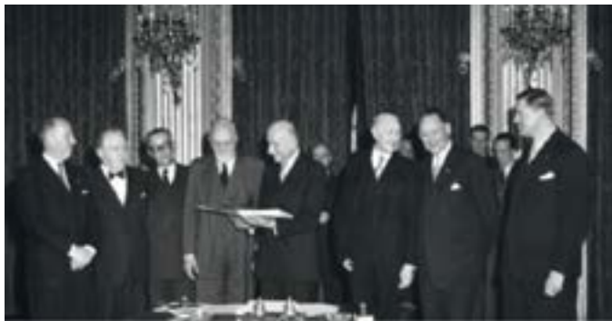
Fondiĝo de la Eŭropa Komunumo pri Karbo kaj Ŝtalo. Parizo 1952

La ĉefa proponanto de tiu projekto estis la franca ministro Robert Schuman kiu estis apogita de la antaŭe malamika germana ŝtato kaj de Usono, potenco kiu finance apogis la rekonstruon de Eŭropo pere de la Plano Marshall . 15 La celo de ĉi tiu komunumo estis la kreo de liber-komerca areo sur preciza kampo: la produktado kaj vendado de karbo kaj ŝtalo. Temis pri du ĉefaj sektoroj en la ekonomioj de la eŭropaj ŝtatoj. Pere de ĉi tiu nova internacia organizo oni difinis kiel celojn starigi komunan merkaton, forigi dogan-tarifojn kaj naciajn stipendiojn, tiel oni certigas liberan konkurencon, malaltigon de la prezoj kaj la sen-interrompan provizadon de tiuj varoj.