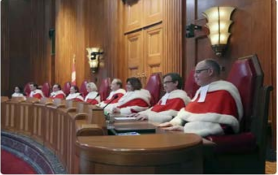
Suprema Kortumo de Kanado en Otavo