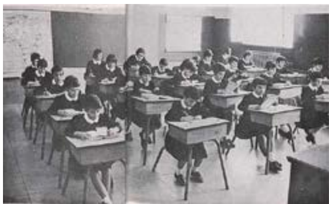
Lernejo en eŭropa lando dum la 50-aj jaroj de la pasinta jarcento

B. Por certigi, ke ĉi tiu interkonsento efektiviĝos kiel eble plej baldaŭ, ĉiuj kiuj naskiĝis en france aŭ angle parolantaj ŝtatoj aŭ en aliaj membro-ŝtatoj de la Konsilio de Eŭropo ricevos instruadon ĉu en la franca, ĉu en la angla, tiel ĉiuj lernantoj povos atingi scipovon en unu el tiuj lingvoj dum siaj lernejoj jaroj.