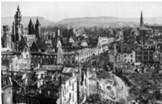
Germana urbo tute detruita dum la Dua Mondmilito

La milito ne nur kaŭzigis troan kvanton da mortintoj kaj la detruon de multaj eŭropaj urboj, kune kun la nuligo de industrioj kaj ruinigo de la kamparo, ĝi ankaŭ ŝanĝis la mondan ordon pro la apero de du novaj superpotencoj, Usono kaj Sovetunio, kiuj ĉefrolis en la eŭropa scenejo de post la jaro 1945.