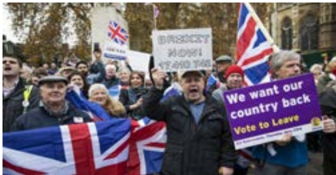
La 1-an de februaro 2022 Britio forlasis la Eŭropan Union

Kompreneble nuntempe, kiam la briteliro 19 estas ĵusa, la adopto de la angla lingvo kiel ununura laborlingvo, aŭ kune kun la franca, estus propono malfacile aprobota de la ŝtatoj de Eŭropa Unio, ĉefe pro la ekonomia forto de Germanio kaj pro la fakto, ke post la briteliro, la angla lingvo nur estas kun-oficiala en Malto kaj en Irlando. Krome, el la statistika vid-punkto, la germana estas la idiomo kiun pli granda nombro da eŭropanoj havas kiel nacian.