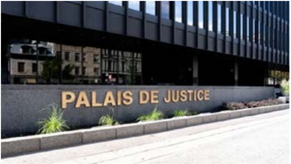
Justica Palaco en Montrealo (Kanado)