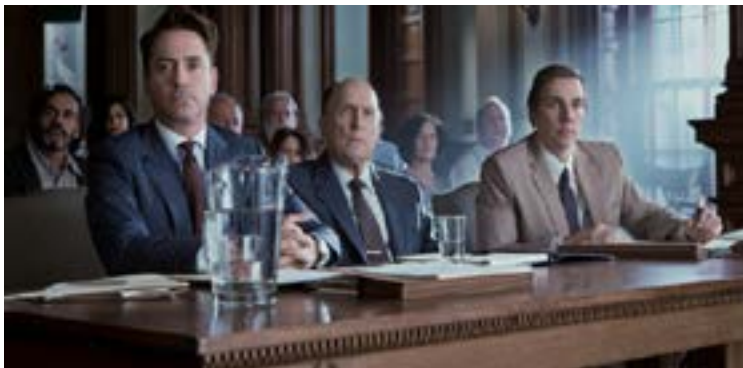
Robert Downey Jr kaj Robert Duvall (advokato kaj akuzito)

Verdire "La Juĝisto" estas dramo, kiu pritraktas la malfacilajn rilatojn inter patro kaj filo. Ankaŭ spertoj travivitaj dum junaĝo aperas kiel fundamentaj por la vivo de kiu ajn, kvankam ili ŝajnas esti forgesitaj. Kaj, se paroli pri juraj temoj, la filmo prezentas jenajn demandojn: Kio estas justico? Kio estas leĝeco?