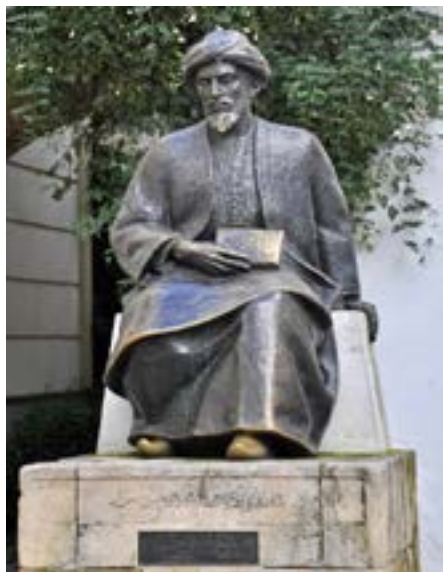
Statuo en Kordovo (Hispanio) de Moseo Majmonido (Kordovo 1138, Kairo 1204), hebrea rabeno, teologo kaj filozofo.

Okulfrape, la vidpunkto de la hebrea filozofo estas tiu de rifuĝinto, ne de generalo, ĉar militisto neniam ĉirkaŭigus urbon nur en tri el ties flankoj, verdire tio eĉ ne estus ĉirkaŭigo. Tamen, la elpenso de la kordova rabeno montras al ni, ke jam en la 12-a jarcento, oni agnoskis, ke oni devis rigardi la civilulojn kiel ne-kombatantojn okaze de milito.