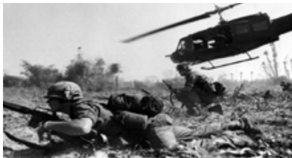
Usonaj soldatoj en Vjetnamo.

Unue, ni komencu per fundamenta principo troviĝanta en la Ĉarto de la Unuiĝintaj Nacioj: «La membroj solvas siajn internaciajn disputojn per pacaj rimedoj, tiel ke la paco kaj la internacia sekureco kaj la justeco ne estu endanĝerigata» (art. 2.3). Ĉi tiu principo estas baza por kompreni la uzadon de forto laŭ la Internacia Juro. Laŭ la antaŭa artikolo, la disputojn oni solvu per pacaj rimedoj: «[...] per intertraktado, esplorado, perado, kompromiso, arbitraciado, tribunala decido, uzado de regionaj institucioj [Eŭropa Unio, ekz.] aŭ interkonsentoj aŭ per aliaj pacaj rimedoj de propra elekto» (art. 33).