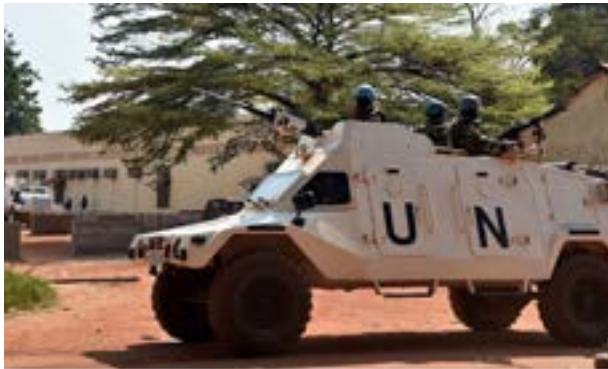
Soldatoj de Unuiĝintaj Nacioj en Centr-Afrika Respubliko

Alia escepto rilatas al Konsilantaro pri Sekureco. La artikolo 42 diras: «se la Konsilantaro pri Sekureco opinias, ke la disponoj laŭ la artikolo 41 estus nesufiĉaj aŭ montriĝus nesufiĉaj, ĝi povas per aeraj, maraj aŭ teraj militfortoj realigi la disponojn necesajn por konservado aŭ restarigo de la monda paco kaj de la internacia sekureco. Tiuj disponoj povas inkludi demonstradojn, blokadojn kaj ceterajn operaciojn de la aeraj, maraj aŭ teraj militfortoj de Membroj de la Unuiĝintaj Nacioj». Ĉio ĉi signifas, ke la Konsilantaro pri Sekuro povas lanĉi atakojn kontraŭ landoj, kie paco ne plu ekzistas. Ni havas multege da ekzemploj: Korea Milito (1950), Gofa Milito (1990), Haitio (2004) kaj Libio (2011), i.a. Tamen, membroj de UN iniciatis intervenojn en landoj sen la aprobo de la Konsilantaro pri Sekureco: NATO en Kosovo (1999) estas la plej okulfrapa ekzemplo, sed ankaŭ troviĝas aliaj konfliktoj kiel la Militoj de Afganio (2001) kaj Irako (2003). Multaj juristoj, fakte, opinias, ke la antaŭe menciitaj militoj estas kontraŭleĝaj.