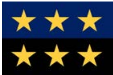
Unua flago de la Eŭropa Komunumo pri Karbo kaj Ŝtalo

Ĉi tiu agad-plano, tio estas la subskribo de internacia akordo serĉanta ekonomiajn celojn kaj kreanta novajn kaj sendependajn instituciojn, denove efektivigis en la jaro 1957. Tiam, pere de la Traktato de Romo, fondiĝis la Eŭropa Komunumo pri Atomenergio, celanta unuigi la produktadon de atoma energio, kaj la Eŭropa Ekonomia Komunumo, kiu celis la kreon de komuna merkato kie homoj, varoj, kapitaloj kaj servoj trovos nenian barilon okaze de interŝanĝoj.