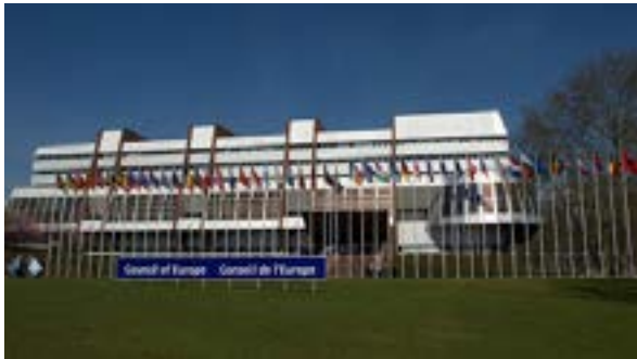
Sidejo de la Konsilio de Eŭropo en Strasburgo (Francio)

Parlamentanoj rajtis voĉdoni spite al aliulaj voloj kaj kompreneble, laŭ demokratiaj principoj. Fine, la 5-an de majo de 1949 en Londono dek ŝtatoj 3 decidis fondi la “Konsilion de Eŭropo”, post kelkaj monatoj aliĝis Grekio kaj Turkio kaj en la jaro 1950 Germanio 4 . La ĉefa celo de ĉi tiu internacia organizo estis stimuli kaj certigi la demokratiajn principojn en Eŭropo, komuna havaĵo de ĉiuj eŭropanoj, favorigi la socian kaj ekonomian progreson de la kontinento kaj plifirmigi la efektivigon de la homaj rajtoj kaj la fundamentaj liberecoj.