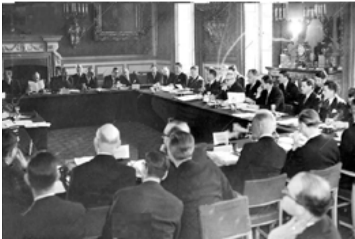
Unuaj kunsidoj de la Eŭropa Unio

“El la vidpunkto de tiuj ŝtatoj parolantaj nek la francan nek la anglan lingvojn, mi devas diri, ke se oni bezonas komunan helplingvon por la ĉiutaga vivo, elektu unu, ne du. Alprenu Basic English 9 , alprenu Esperanton, la sola helplingvo por ĉiutaga vivo laŭ mi scias. Mi ne parolas Esperanton, mi ne konas Esperanton, tamen mi scias, ke proksimume 900.000 homoj antaŭ ne-longe sendis peton al Unuiĝintaj Nacioj favore al la adopto de Esperanto. Ĉi tiu peto estis subskribita de la Prezidanto de la Franca Respubliko, de la Ĉefministro de Nederlando kaj de multaj aliaj famaj homoj tra Eŭropo kaj la tuta mondo. Sendube io ekzistas ene de tiu lingvo kaj mi min demandas kial la Komisiono ne konsideris ĉi tiun solvon por la problemo.”