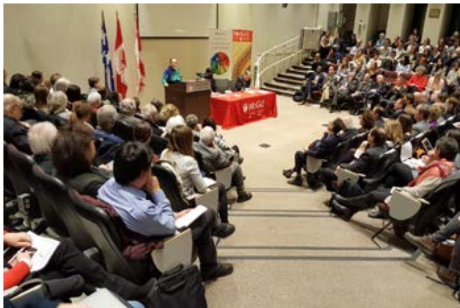
Jura Fakultato en la Universitato McGill Montrealo (Kanado)