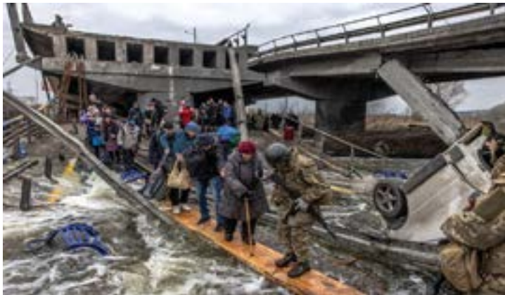
Civiluloj meze de atakoj de Rusio kontraŭ Ukrainio