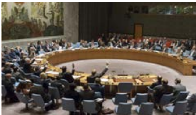
Konsilio pri Sekureco de Unuiĝintaj Nacioj

En la Ĉapitro 6-a de la Ĉarto, oni trovos manierojn pace solvi la internaciajn disputojn. Tamen, ni devas aldoni gravegan principon, kiu estas nepraĵo rilate al ĉi tia temo: «La membroj detenas sin, en siaj internaciaj rilatoj, je minaco aŭ uzo de forto, ĉu kontraŭ la teritoria integreco aŭ politika sendependeco de ia ajn ŝtato, ĉu en ia alia maniero malkongrua kun la celoj de la Unuiĝintaj Nacioj» (art. 2.4). Ĉi tiu artikolo, fakte temas pri ius cogens kaj samtempe pri laŭmora normo (Kazo rilate al la armeaj kaj paraarmeaj agadoj en kaj kontraŭ Nikaragvo; Nikaragvo kontraŭ Usono). Aldone, la Rezolucio 2625 (XXV) de la Ĝenerala Asembleo enhavas jenon rilate al la uzado de forto: «Nepras, ke ŝtatoj solvu siajn internaciajn disputojn per pacaj rimedoj laŭ la Ĉarto». Estas aliaj rezolucioj gravaj rilate al la uzado de forto: Rezolucio 3314 (XXIX) kaj Rezolucio 42/42, ĉi tiu lasta treege grava. Efektive, la uzado de forto estas malpermesita laŭ ĉio, kion ni ĵus legis. La Ĉarto preferas, ke internaciaj disputoj estu solvitaj per pacaj rimedoj (art. 2.3 kaj Ĉapitro 6-a) kaj ne pere de perforto (art. 2.4). Tamen, la realo estas pli proza, kiel diradis eminenta profesoro al mi.