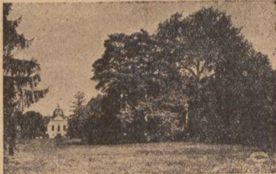
Gödöllő — mondĵamborea loko.

La venonta Internacia Ĵamboreo okazos dum la unuaj semajnoj de aŭgusto 1933.