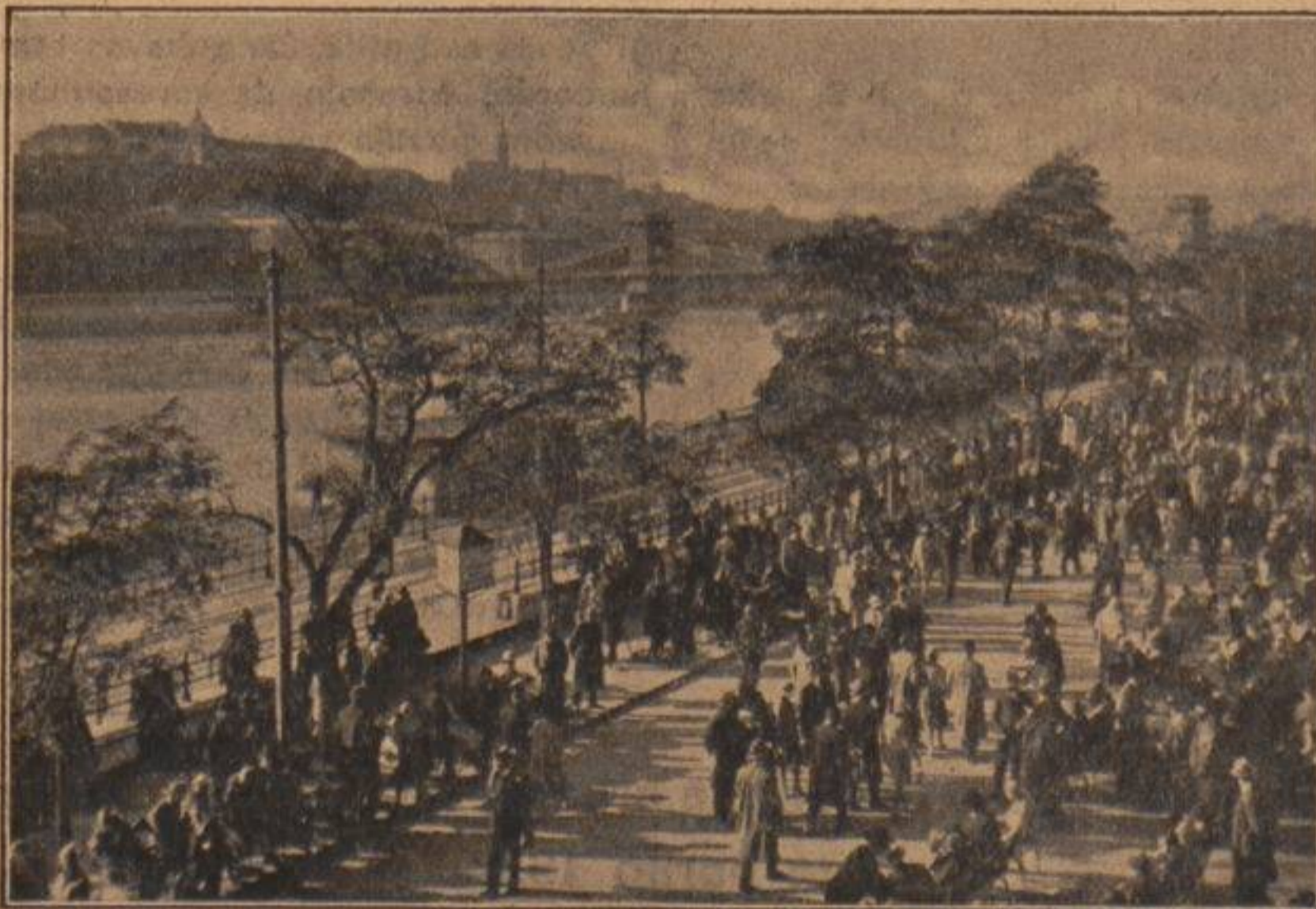
Promenadstrato apud Danubo.

La Hungara ĉefurbo estas por la granda parto de la mondo tute nekonata. Malmultaj scias, ke ĝi havas proksimume milionon da loĝantoj kaj konkuras per vigla moderna vivo inter komforte konstruitaj domoj kun la similgarandaj eŭropaj kaj uŝonaj urboj. Ankaŭ malmultaj scias, ke la hungara lingvo apartenanta ne al la hindeŭropa, sed al la finugra lingvofamilio, estas ne nur la sola oficiala lingvo de la lando, sed ĝi atingis tajn kulturajn altecojn, kiajn la esperantistaro povas ĝui en la tradukoj de „La tragedio de la homo, Johano la brava“ k. a. La scio de Esperanto do estas en Budapest pli necesa, ol en la okcidenteŭropaj grandurboj, ĉar fremdulo nenion povas kompreni el la hungara lingvo, tre diferenciginta de la okcidentaj lingvoj. Kvankam en preskaŭ ĉiuj pli gravaj lokoj de la urbo oni parolas germane, en la hoteloj ankaŭ france, angle, kaj aliajn lingvojn, nur Esperanto povas helpi al la pli intima konatiĝo kun la popolo, moroj kaj vivo. En kelkaj hoteloj, kiel en Imperiestra Banejo (Császár-fürdő) kaj