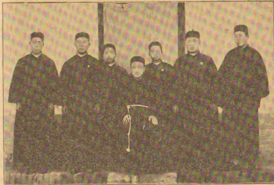
Ekzekutiva Komitato de la ĥina nacia sekretariejo de MOKA.

SPECIMENAJ NUMEROJ de J. B. estos sendataj senpage al la adreso de seriozaj interesuloj, kiujn vi sendos al ni!