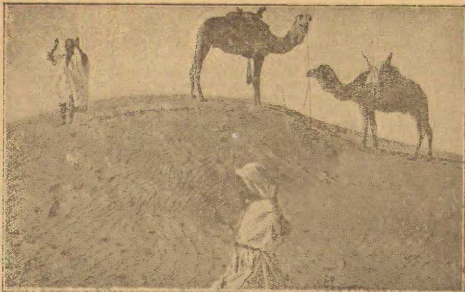
Preĝo en la dezerto.