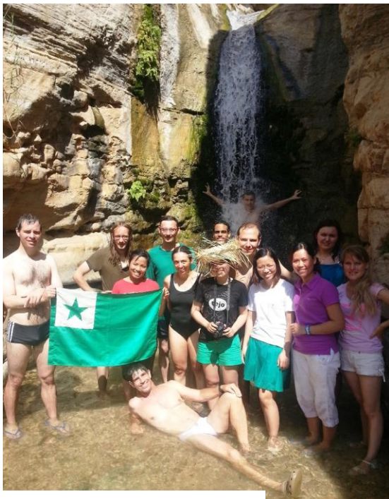
La post- IJK en rivero Arugot

Beit-Ŝean estis la unua loko kiun ni vizitis, sub varmega suno, sed kun gustumado de granatoj prenitaj el granatarboj apud la ruinoj. De tie ni iris al Sahne, kie ni naĝis en naturaj basenoj kaj manĝis bongustan akvomelonon aĉetitan en Nazareto. Ni daŭrigis la vojaĝon suden kaj starigis nian kampadejon ĉe la Morta Maro. La nokta mallumo permesis al ni vidi la stelojn, kaj matene ĉiuj vekiĝis frue por vidi la sunleviĝon kaj naĝi antaŭ foriri.