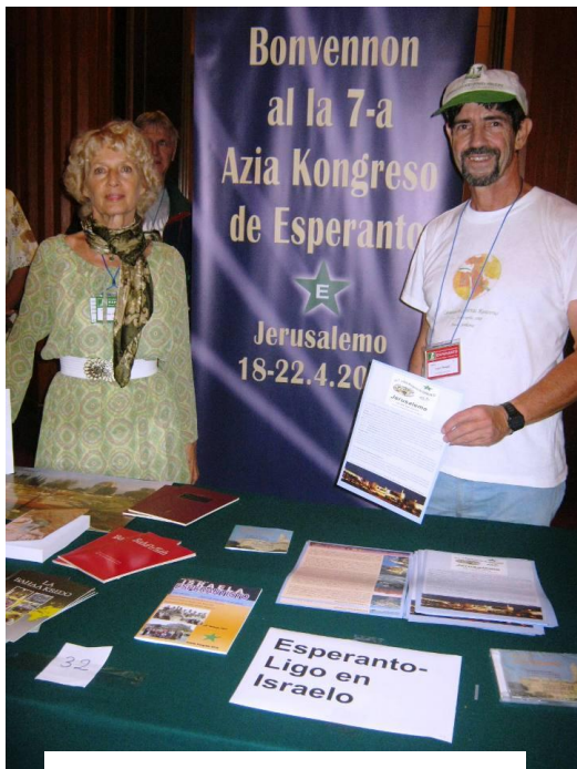
Movada Foiro: ELI-budo en Hanojo