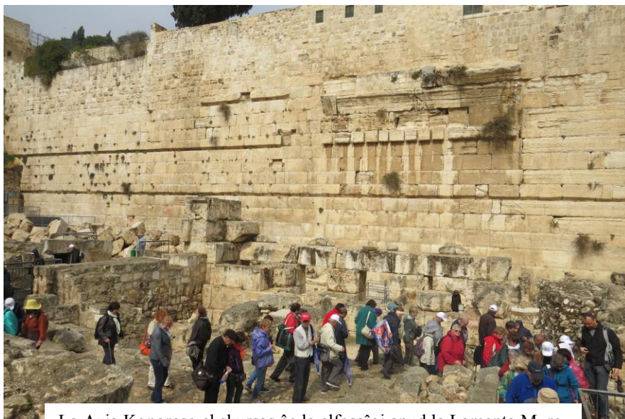
La Azia Kongreso ekskursas ĉe la elfosaĵoj apud la Lamenta Muro