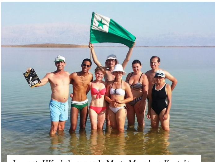
La post- IJK-ekskurso en la Morta Maro kun Kontakto