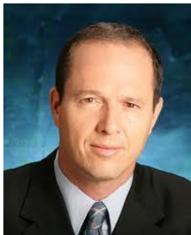
Alta Protektanto: la urbestro de Jerusalemo Nir Barkat

Aprilo 2012. La kongreso proksimiĝas, kaj la petoj fariĝas pli oftaj kaj urgaj. Jam estas 150 aliĝintoj. Ankoraŭ mankas Alta Protektanto. La oficejo de la prezidento Ŝimon Peres (Alta Protektanto de la UK en Tel-Avivo en la jaro 2000) longe prokrastis la respondon, sed fine afable rifuzis pro troa okupiteco. Mi skribis al la urbestro de Jerusalemo, Nir Barkat, kiu bonŝance akceptis, sed petis proponon de saluta teksto. Mi verkis proponon, kiun la urba parparolisto iomete modifis.