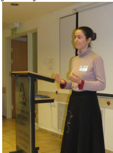
La aŭtorino prelegas pri eŭritmio

Dum la jaro 2013 okazis du tre gravaj esperantaj eventoj en Israelo. La 7-a Azia Kongreso, en Aprilo, la unuan fojon en Israelo, kaj la 69-a Internacia Junulara Kongreso, en Aŭgusto, la duan fojon en Israelo. Inter la esperantistoj, el proksime kaj fore, estis ankaŭ kelkaj, kiuj unuafoje vizitis Israelon, aŭ internacian Esperanto-eventon, aŭ eĉ unuafoje vizitis alian kontinenton. Unu kroma afero, kiu envenis Esperantujon verŝajne je la unua fojo dum tiuj du kongresoj, estas unika speco de arto, relative nova: 25 jarojn pli juna ol Esperanto. Tiu ĉi arto videbliĝas per tre specialaj movoj, personaj kaj koregrafiaj, koloraj lumoj kaj specialaj silkaj vestaĵoj; movoj, per kiuj la