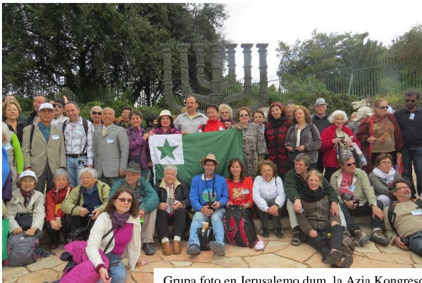
Grupa foto en Jerusalemo dum la Azia Kongreso

Jerusalemo, ĝis la vespermanĝo – kleriga programo (prelegoj), kaj post la vespermanĝo – arta kaj distra programo.