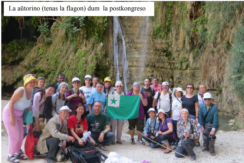
La aŭtorino (tenas la flagon) dum la postkongreso