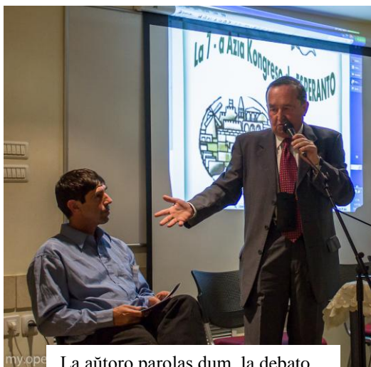
La aŭtoro parolas dum la debato

Kaj kion pensas la alia parto, la araboj, kiuj ne estis reprezentitaj en la debato (krom de mi, honora arabo). Vi eble ne volos kredi tion, sed la araboj estas kiel la israelanoj. Ankaŭ ili havas tri poziciojn: