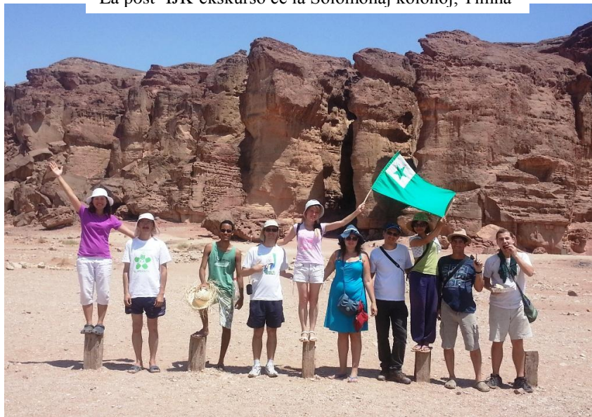
La post- IJK-ekskurso ĉe la Solomonaj kolonoj, Timna