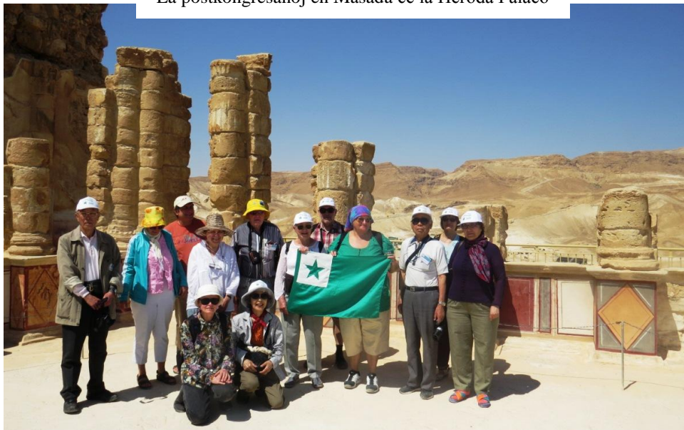
La postkongresanoj en Masada ĉe la Heroda Palaco

Merkredo 24.4. Leviĝinte je la 5a matene ni ekgrimpis la monton de Masada per la "Serpenta Pado", por spekti la sunleviĝon super la montoj de Moab, ĉe la orieneta bordo de la Morta Maro. Sekve ni vizitis la elfositan palacon de Herodo, kie ĉ. mil judaj ribelantoj kontraŭstaris dum multaj monatoj la sieĝon de grandega romia armeo; kiam ne plu restis ŝanco kontraŭbatali, ili ĉiuj sinmortigis por ne esti kaptitaj de la romianoj. Ni pluveturis suden, survoje aŭdis pri la ekologia problemo de la Morta Maro, kies norda parto perdas ĉiujare pli ol unu metron de sia nivelo, dum la suda parto fariĝis vaporiga baseno por produkti mineralojn. Por sensalumi nin ni promenis tra la oaza rivero Bokek ĝis ties ĉarmaj akvofalo kaj baseno. Pli sude ni vidis sal-kolonon kiu nomiĝas "la edzino