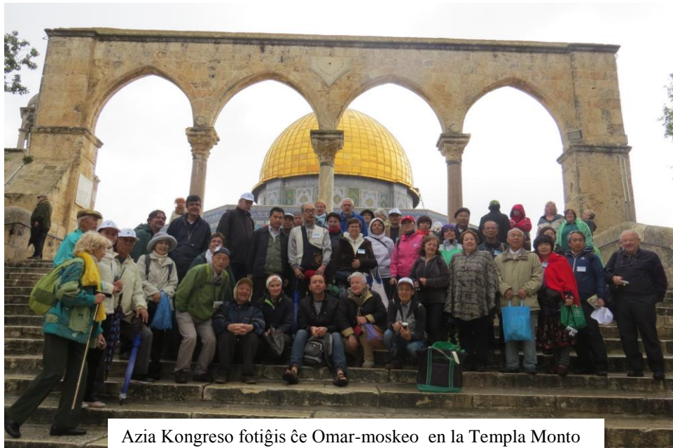
Azia Kongreso fotiĝis ĉe Omar-moskeo en la Templo Monto