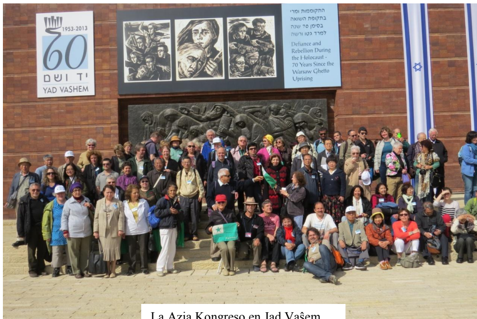
La Azia Kongreso en Jad Vašem