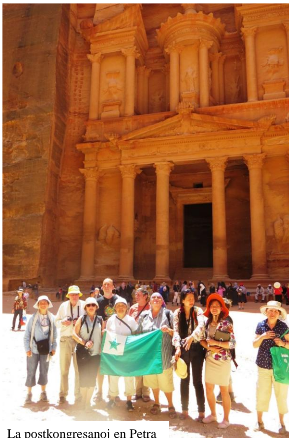
La postkongresanoj en Petra

de Lot" kaj eniris kavernon en la monto de Sodomo, la plej granda salmonto en la mondo. De tie ducent-kilometra veturado tra la ŝoseo Arava, laŭlonge de la limo kun Jordanio. Survoje ni haltis ĉe Moa, antikva dezerta gastejo de la Nabateoj, kiu servis la kamelo-karavanojn sur la "Vojo de Parfumo" el Petra al la Mediteraneo. Antaŭ ol alveni al Eilat ni pasis apud la dezert-besta rezervejo Jotvata-parko, kie libere paŝtas diversaj bestoj importitaj el eksterlandaj dezertaj regionoj kaj reloĝigitaj ĉi tie: struto, onagro (sovaĝa azeno), cervo ktp. Vespere ni alvenis al Eilat ĉe la Ruĝa Maro.