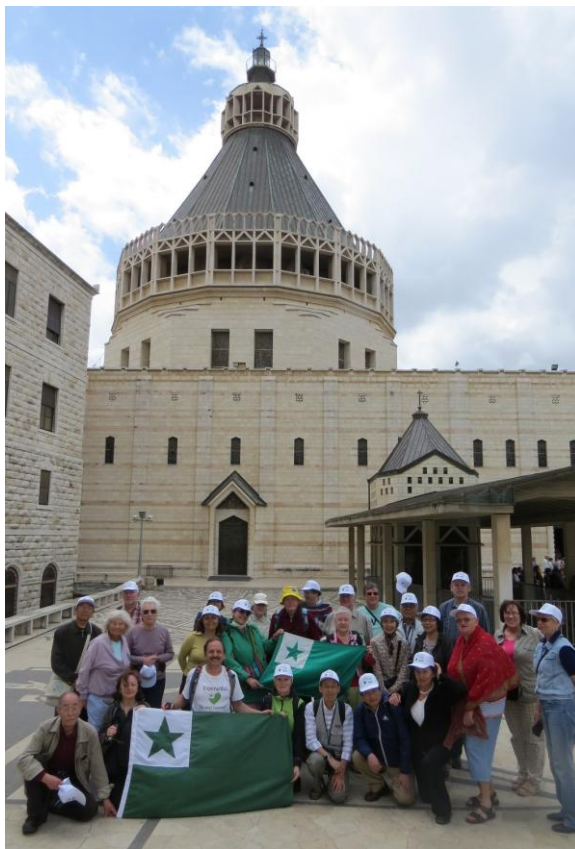
La antaŭkongresa ekskurso ĉe Preĝejo de Anunĉiacio

Mardo 16.4 – du tagoj antaŭ la kongreso. Mi ĉiĉeronis la antaŭkongreson en Nazareto kaj la Tiberiada Lago. Dum la busveturado de Hajfo al Nazareto mi disdonis al ĉiuj la kongresajn ĉapojn, kiuj en la antaŭa tago alvenis de la presejo. Nazareto estas la plej granda araba urbo de Israelo, kun 70,000 enloĝantoj, parte kristanoj kaj parte islamanoj. Ni vizitis la plej gravan lokon por kristanismo en Nazareto - la Preĝejo de Anunĉiacio. En tiu loko, laŭ la kristana kredo, la anĝelo anoncis al Maria ke ŝi estos graveda kun Jesuo. En la korto ni vidis tabulojn de Maria, donacitajn de diversaj popoloj, inter ili ankaŭ unu en Esperanto.