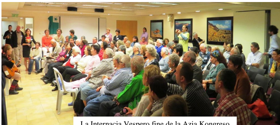
La Internacia Vespero fine de la Azia Kongreso

neforgesebla, eble la plej kortuŝa de mia vivo de esperantisto !! La sukcesa Internacia Vespero estis por multaj la pinto de la Azia Kongreso kaj inda finalo.