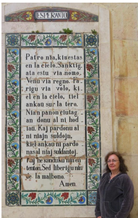
Kongresanino ĉe "Patro Nia", Oliva Monto

Sabato 20.4. Matene – ekskurso al la Oliva Monto. Pli ol 100 kongresanoj venis al la observejo sur la Oliva Monto, kiu superrigardas Jerusalemon de oriente. Estas belega pejzaĝo de la Templo Monto kun la "Kupolo de la Roko" en ties centro (konata ankaŭ kiel "Moskeo Omar"), kun la ora kupolo, unu el la plej famaj simboloj de Jerusalemo. Pro tiu bela pejzaĝo oni faris grupan foton kun la Esperanto-flagoj. Sekvis vizito en la Preĝejo Patro Nia (konata ankaŭ per la nomo Eleona), konstruita fine de la kvara jarcento. Ĝi estas fama pro la preĝo "Patro Nia", kiu aperas sur ĝiaj internaj muroj en pli ol cent lingvoj,