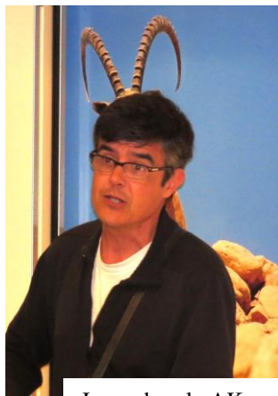
Jomo dum la AK

Multajn similajn mesaĝojn mi ricevis, rete kaj buŝe, post la Azia Kongreso kaj ĝia postkongresa ekskurso. Ili estis taŭga kompenco por tio, kio estis verŝajne mia plej granda Esperanto-projekto, plej granda laboro, sed ankaŭ plej feliĉiga sperto. Eĉ pli malfacila ol la organizado de la Universala Kongreso en Tel-Avivo en 2000, ĉar tiam kunlaboris multaj personoj kaj instancoj, UEA, LKK kaj profesia vojaĝagentejo. La Azian Kongreson devus