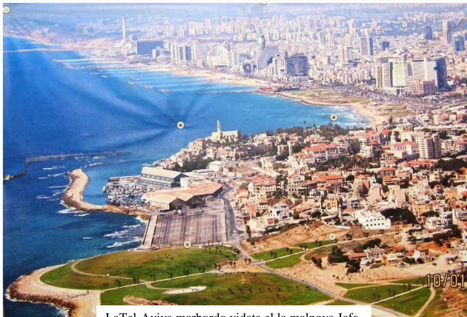
LaTel-Aviva marbordo vidata el la malnova Jafo

Kvar tagoj antaŭ la kongreso: dimanĉo 14.4. Gabi gvidas la unuan tagon de la antaŭkongreso: vizito en Malnova Jafo, la 4000-jaraĝa fratino de la juna, 100-jara, Tel-Avivo; la "Montpinta Parko", kun bela pejzaĝo de la marbordo de Tel-Avivo, kaj ties moderna promenejo kaj hoteloj. En unu el