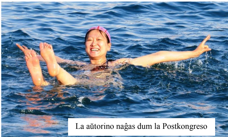
La aŭtorino naĝas dum la Postkongreso

Jen, tiel estas mia unuafoja maskosperto! Ĝia gusto estas sala kaj dolĉa! Mi unuafoje vidis la mirindan submaron! “Unuafoje” ĉiam estas neforgesebla, ĉu ne?